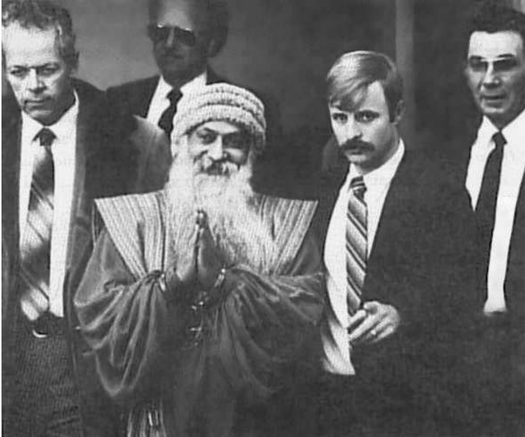
Osho in de boeien...

Dit is pure wraak. Maar U ziet er zo rustig en kalm uit, bijna alsof u plezier hebt in de hele reis.'