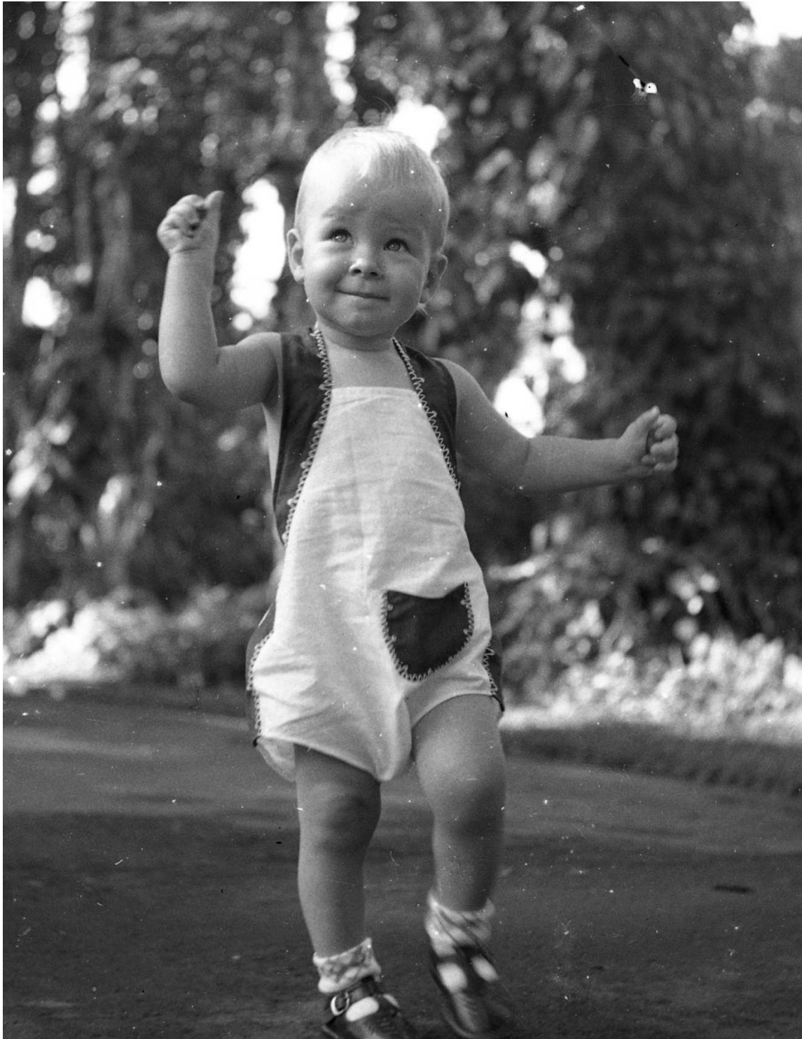
Pari in 1940. Buitenzorg, Indië. Niet zoveel veranderd, nu, in 2014. In elke hand een mooi kiezelsteentje?