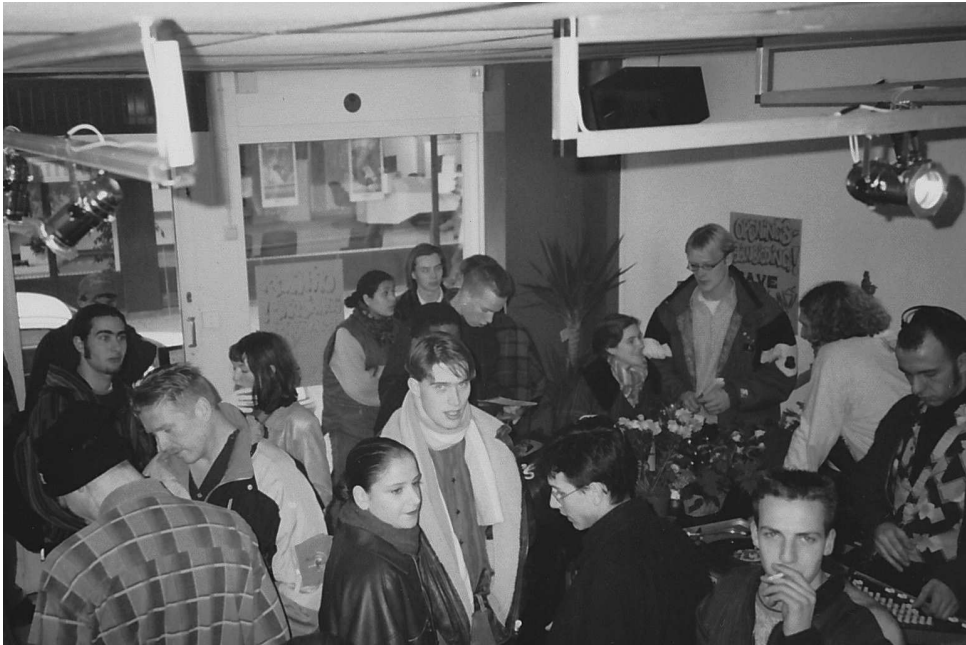
Enorme drukte in de winkel tijdens de opening van de platenzaak aan de Bloempotsteeg