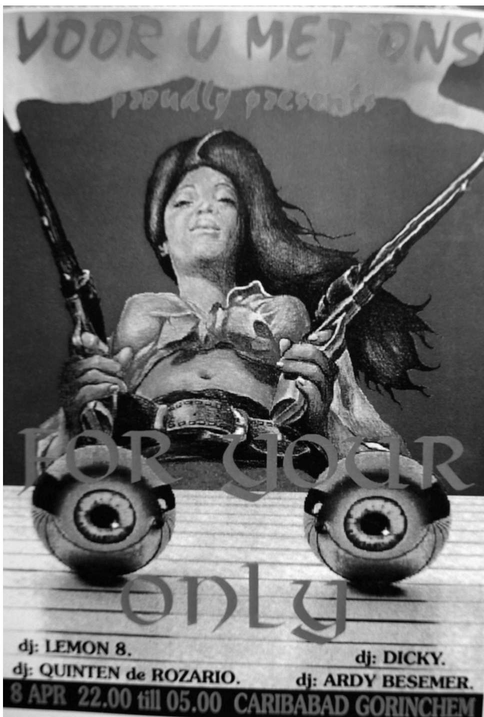
Flyer van het zwembadfeest For Your Eyes Only, dat in april 1996 werd gehouden in het Caribabad