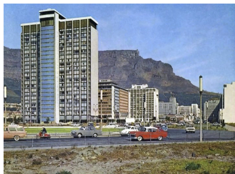
De rotonde vlakbij voor het centrum en de haven van Kaapstad.