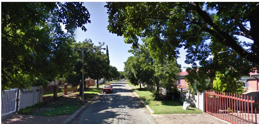
Nu 2014, Jannie de Waalstraat te Vanderbijlpark, Transvaal, Zuid-Afrika... onze vroegere straat...