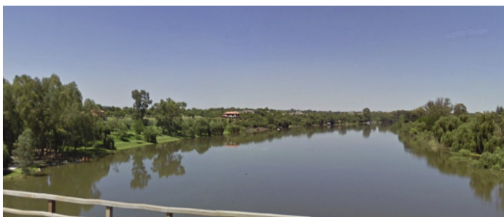
De Vaalrivier in Vanderbijlpark.