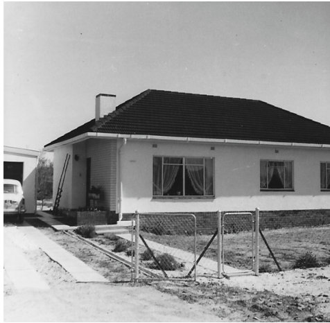
Het huis van mijn ouders in Tabel View, Kaapstad 1968.

We woonden in een leuk klein bungalowtje te Table View in Kaapstad met 'n flinke tuin, en daarin stond ook een garage. Die tijd reed ik op 'n Honda motor en elke avond als ik thuis kwam plaatste ik mijn motor achterin de garage. Het huis stond in een nieuwe wijk. Er stonden maar hier en daar nieuwbouwhuizen. Je kon wel zeggen, we woonden in de bush. Dus er zaten flink wat wilde dieren, zoals slangen, roofvogels, schorpioenen, grote vogelspinnen, etc. Maar zoals men ondervindt: de dieren zijn meestal bang voor de mensen. Alleen niet als ze in 't nauw komen te zitten. We hadden ook last van ratten. Vooral tegen de zomer. Op een morgen ging ik naar mijn werk, dus ik liep naar de garagedeur en tilde hem aan de handgreep een beetje omhoog. Dan plaatste ik mijn beide handen links- en rechtsonder de garagedeur en drukte hem zo omhoog. De garagedeur werkte met contragewichten, maar men moest wel wat kracht uitoefenen om hem naar boven te krijgen. Ik had de garagedeur bijna in z'n bovenste stand. Mijn handen waren nu bijna gestrekt en had nog steeds de garagedeur boven mijn hoofd vast.