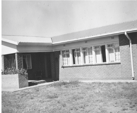
Ons nieuwe huis in de Jannie de Waalstraat 20 te Vanderbijlpark, ZA.

Bij ons vlak in de buurt was 'n tamelijk grote rivier, nl. de Vaalrivier. 's Zomers gingen wij daar vaak zwemmen. Op 'n middag toen ik van school kwam ging ik er ook in m'n ééntje naar toe.