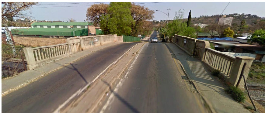
13 de Laan.

Ja, dat heb je gauw met de hitte in de tropen.