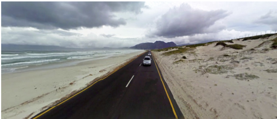
De Baden Powell Road, Muizenberg, Kaapstad, Zuid-Afrika.

We begonnen weer en na 'n tijdje hielpen er toch weer mensen ... en later rustig met de aanwezigen, etc... en alles kwam weer goed.