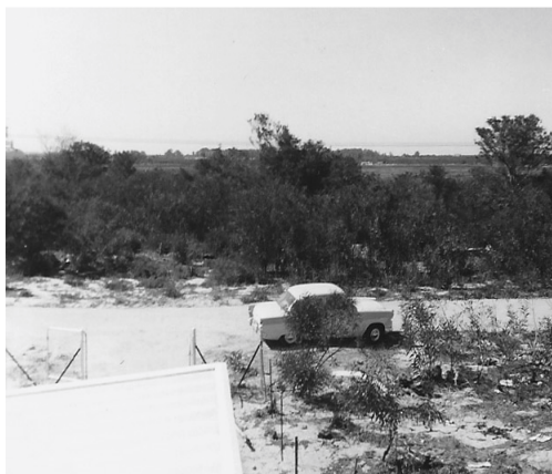
Kees Poll z'n wagen. Genomen vanaf het garage-dak te Table View in 1968.

Bij een krant (Die Burger) in het centrum van Kaapstad was ik leerling retoucher. Op 'n morgen kon ik meerijden met onze kostganger Kees Poll, die toevallig ook de hele dag in Kaapstad moest zijn. We hadden afgesproken dat hij mij om plusminus 5 uur zou ophalen bij de drukkerij. Die tijd bezat hij 'n tweedehands oude auto, nl. een Ford Zyver (zie foto). Voor die tijd ook al 'n oudje.