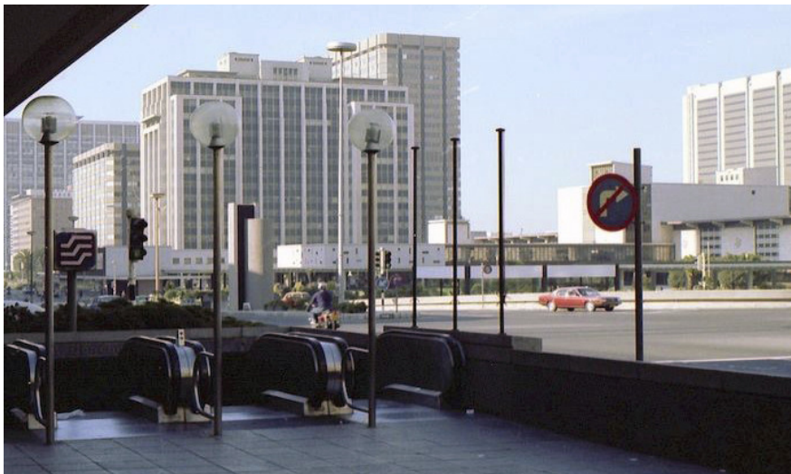
Parkeergebied bovenop het centraal-station te Kaapstad.