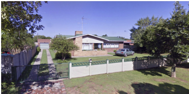
Zo ziet ons voormalige huis er nu uit in 2014, Jannie de Waalstraat 20 in Vanderbijlpark, Zuid-Afrika