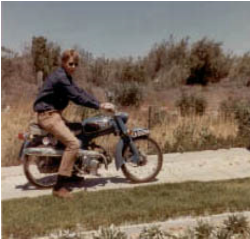
Mijn eerste motor.