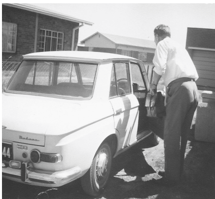
Pa stapt in z'n Datsun Bluebird.

Vroeger waren wij met z'n allen geëmigreerd naar Zuid-Afrika. We woonden in een dorpje vlakbij Kaapstad aan zee, Table View. Op 'n zomerse dag stond de wind uit 't westen en gingen we dus naar 'n strand achter de Tafelberg, richting 't plaatsje Muizenberg, waar de wind dus niet kwam. De Tafelberg en de rest van de bergen hielden de wind tegen.