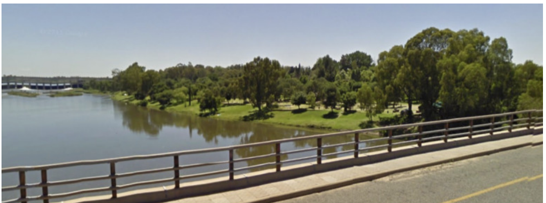
De Vaalrivier in Vanderbijlpark.