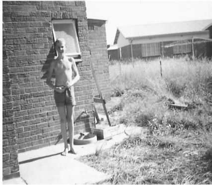
In onze achtertuin 1966.