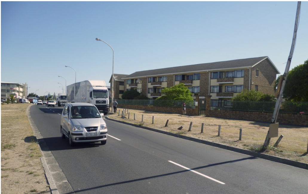
De flat te Milnerton, waar we als eerste woonden.. Foto is van onze vakantie in dec. 2010.