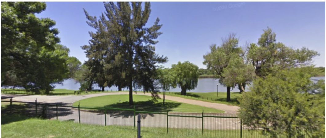
De Vaalrivier in Vanderbijlpark.

Die tijd was ik twaalf jaar en het beeld zie ik nog steeds voor me, maar ik weet nu wat ik moet doen als er iemand 'n tijdje onder water is geweest.