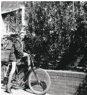
Op m'n fiets in 1966 naar school.

Op school de Hoër Tegniese Skool de Carel de Wet zat m'n Zuid-Afrikaanse vriend altijd naast me. Zo op 'n dag kregen wij biologie. Die dag vertelde de meester hoe je zelf gemakkelijk dynamiet kon maken. Wij met 'n onschuldig stemmetje: "hoe bedoelt u? Wat heb je precies nodig?" Mijn vriend noteerde dit, terwijl ik dit vroeg.