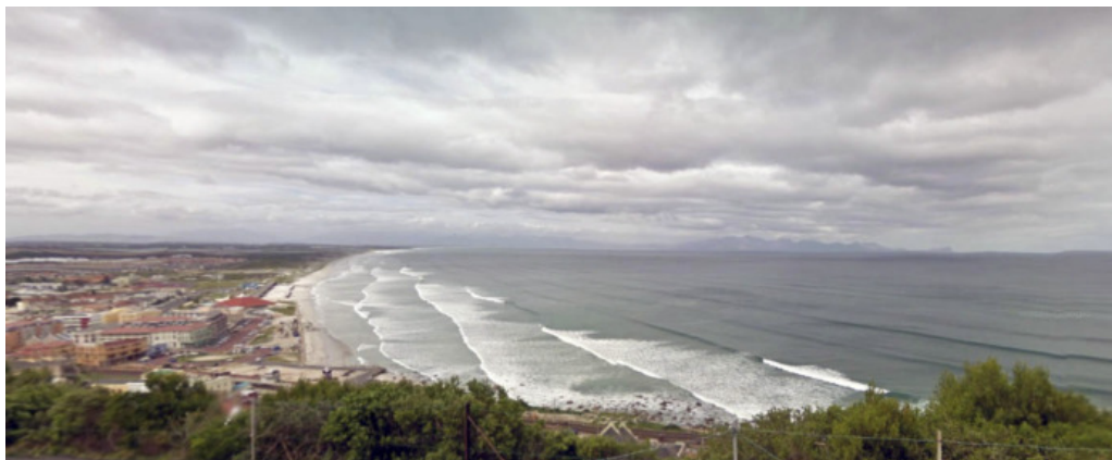
Muizenberg, Kaapstad, Zuid-Afrika.