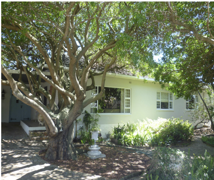
Zo ziet het huis er nu uit in dec. 2010 te Table View. Gevonden en gefotografeerd tijdens onze vakantie.