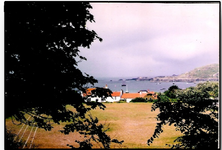
Ankerbaai van Alderney

Bij springtij de haven van Cherbourg uitgezeild bij een zwakke noordwester. De geweldige stromen bij 'Cap de la Hague' en vooral in de beruchte 'race' daarna, sleuren ons in iets meer dan drie uur naar het 25 mijl verderop gelegen kanaaleiland Alderney. Een geweldige sensatie! Voor tien pond mag je hier de eerste nacht aan een mooring liggen, de tweede nacht is dan gratis. De boot naar