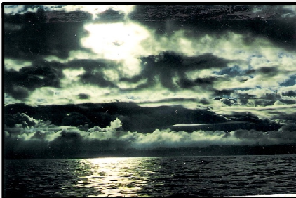
Wilde nacht langs Quessant

analy six' meldt de Navtex opgewekt. Nee, alles gaat nog niet echt gemakkelijk.