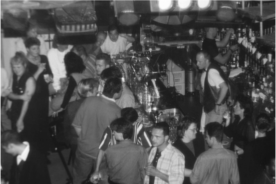
Drukte aan de bar bij Fame