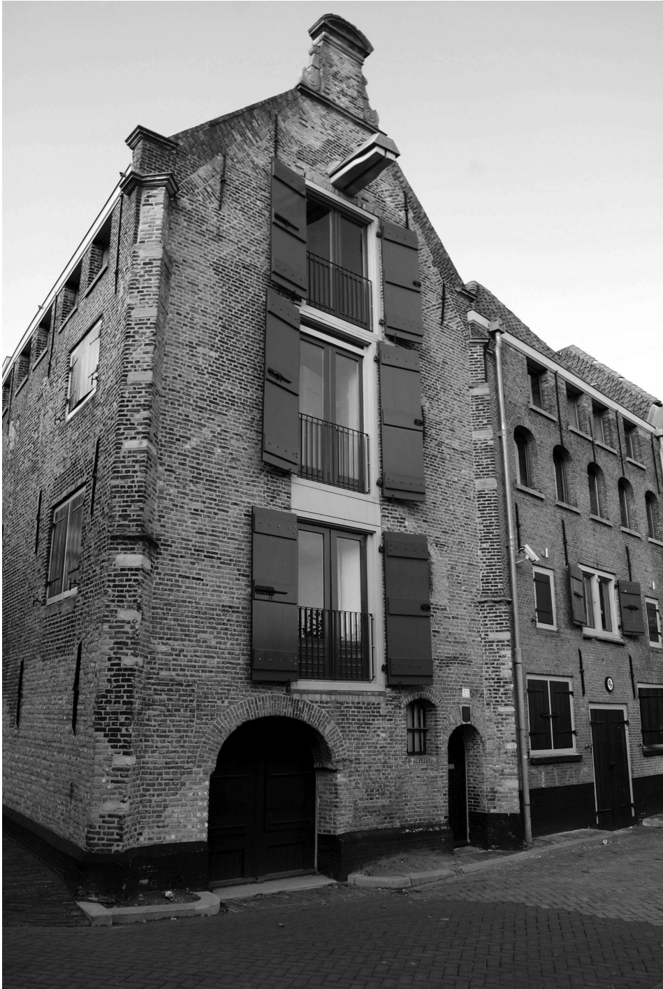
Het befaamde Dolhuis, met links de geluidsstudio en rechts de discotheek