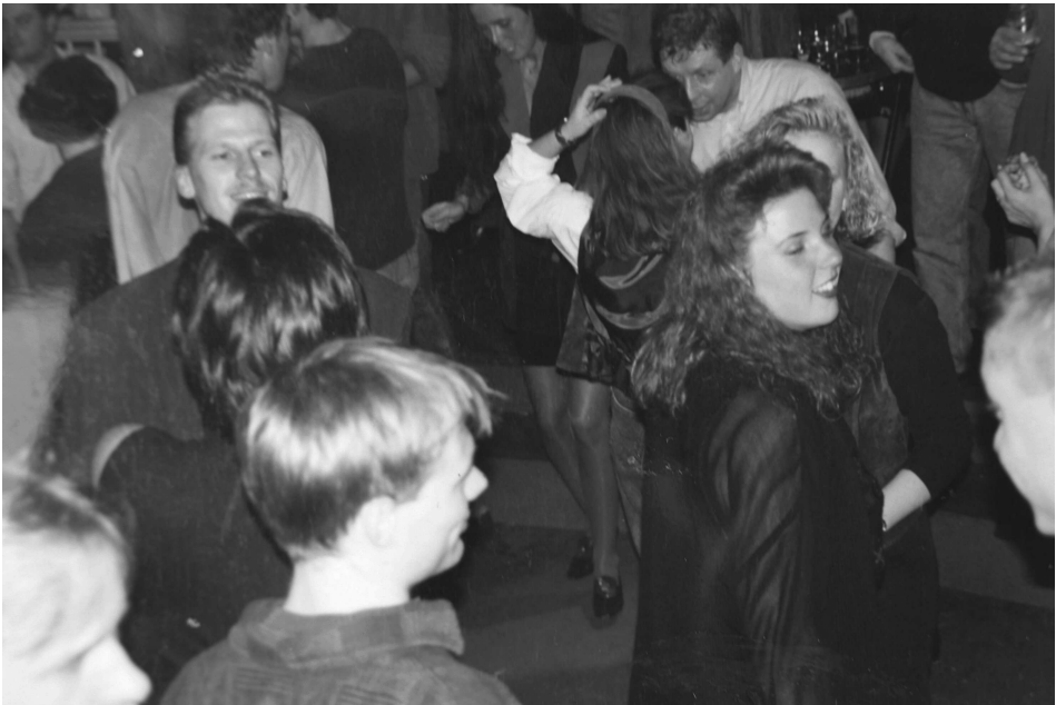
Publiek op de dansvloer van Fame