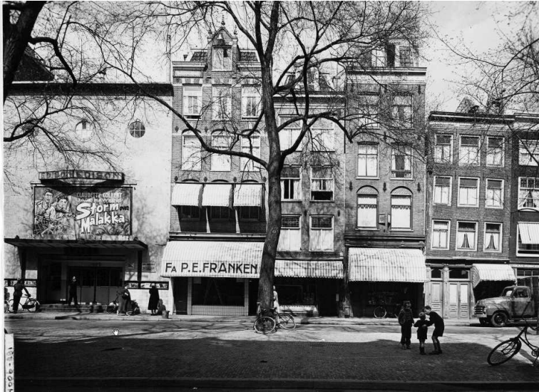
De Elandsgracht, met links het Edison Theater.

In 1959 zong hij in Londen zijn Jordaanlied in een televisieshow met Nederlandse artiesten onder leiding van Wim Sonneveld.