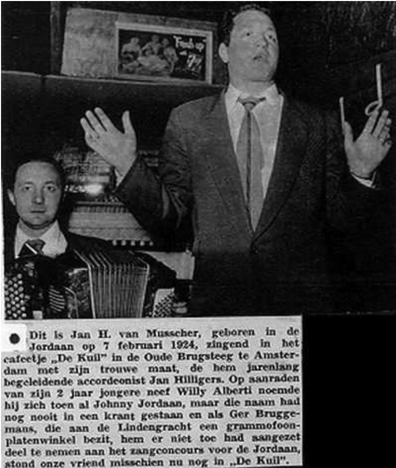
Johnny Jordaan in 1954 in de Oudebrugsteeg 27.

Dit jaar is het zestig jaar geleden dat de grote zanger van het Amsterdamse levenslied zijn doorbraak beleefde en in een paar maanden uitgroeide tot de populairste zanger van Nederland en Vlaanderen.