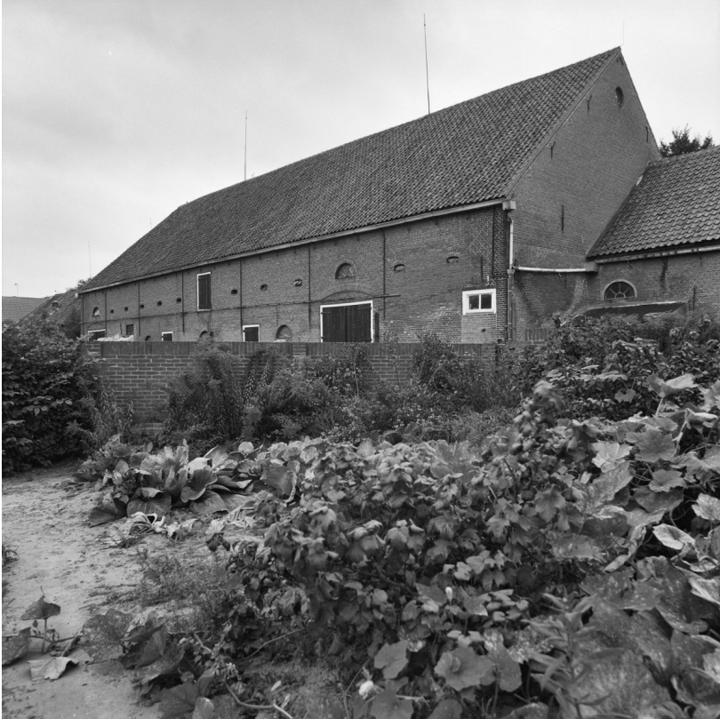
Achterzijde van 'De Barakken'.

kazerne had altijd een eigen voorraad levend vee voor voedsel en melk. Het leverde de Pruisen twee gebroken armen, een gebroken been en een hoop schrammen en bulten op. Bovendien was er veel schade aan uniformen en andere materialen. Dat was vervelend want iedere soldaat was verantwoordelijk voor zijn eigen uniform.