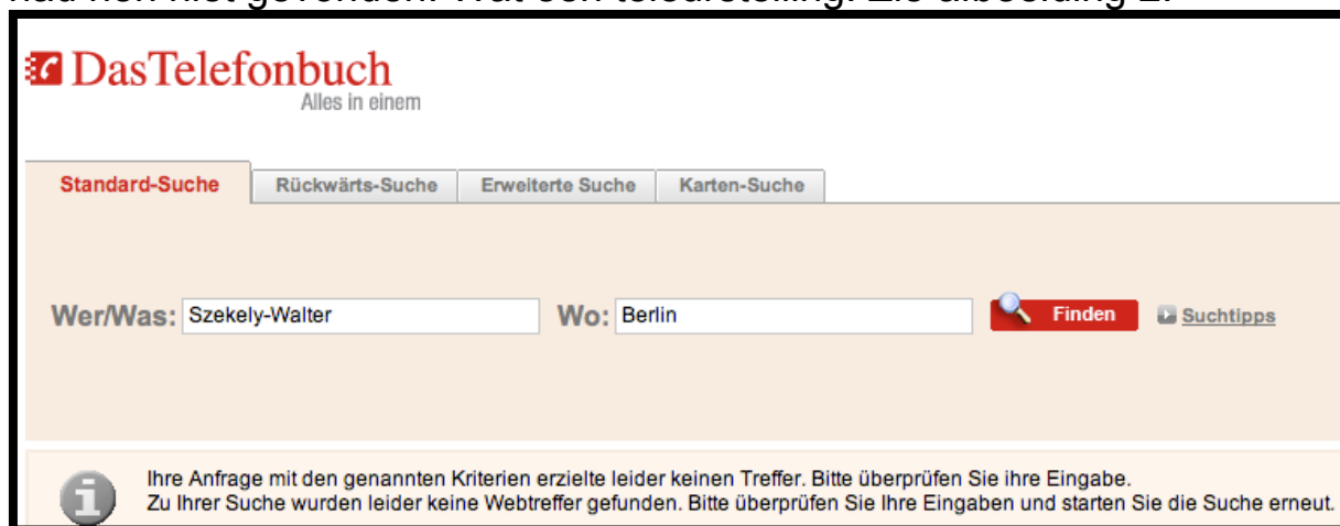
Afbeelding 2: telefoonboek Duitsland Szekely-Walter

Via internet had ik natuurlijk allang dit telefoonboek 13 geraadpleegd en ik had hen niet gevonden. Wat een teleurstelling. Zie afbeelding 2.