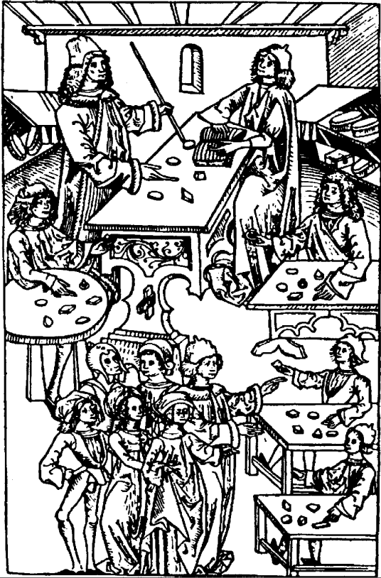
De stenen dokter - oude houtsnede

André Molenaar - St. Urban (Oostenrijk) 2011