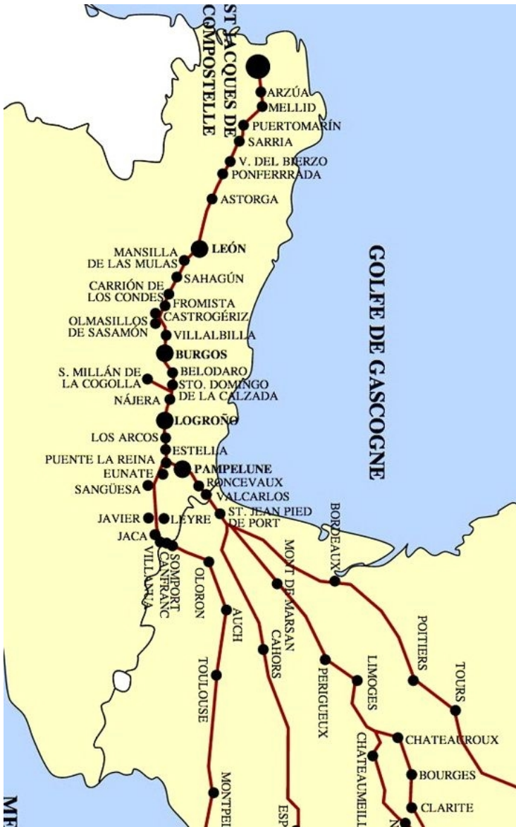
Van Bergerac (bij Bordeaux) naar Santiago