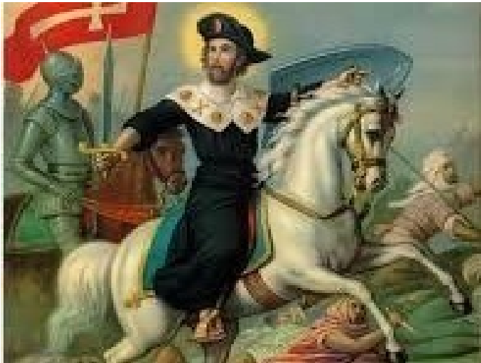
Sint Jacobus Matamoros als Morendoder

waarop uiteindelijk de imposante kathedraal van Santiago is gebouwd. Zijn graf werd ontdekt in 813. Zijn lichaam zou bedekt zijn geweest met een type schelp dat later de naam jakobsschelp zou krijgen. De ontdekking van het graf werd al snel in samenhang gebracht met de strijd tegen de Moren omdat de christenen in het uiterste noorden stand wisten te houden. De plaats waar het graf gevonden werd kreeg de naam Santiago, het Spaanse woord voor Sint Jacob.