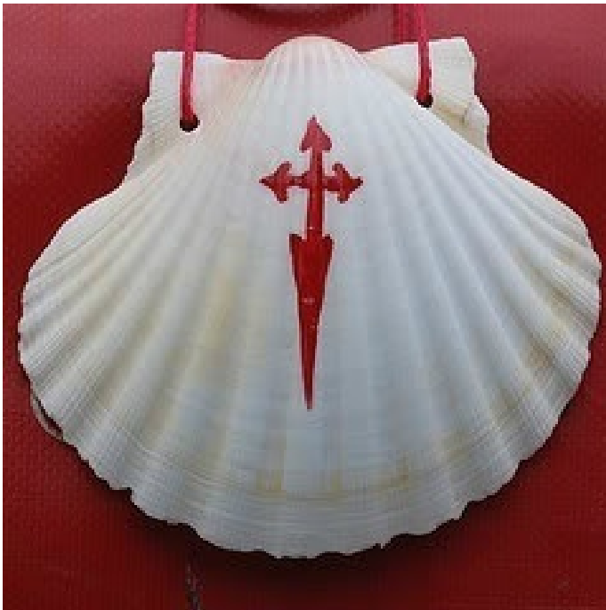
St Jacobsschelp met de afbeelding van de Orde van het Rode Zwaard

voornamelijk christelijk. Vandaar uit begonnen de christenen langzaam aan de herovering op de Moren. Deze herovering staat bekend als de Reconquista . Pas in 1492 werd het laatste Moorse bolwerk Granada ingenomen door de legers van de katholieke koningen Fernando II van Aragon en Isabel I van Castilië. Het was niet toevallig dat in hetzelfde jaar Columbus Amerika ontdekte. De koningen gaven pas groen licht aan Columbus na de euforie van de inname van Granada.