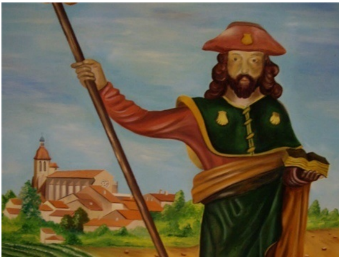
Sint Jacobus als Peregrino (pelgrim)

Voor een beter begrip van de historische context waarin we onderweg de vele historische en culturele bezienswaardigheden tegenkomen geef ik hieronder een korte beschrijving van de periode waarin de Camino Francès zich ontwikkelde tot de belangrijkste pelgrimsroute in Europa. Het was een roerige tijd die zich