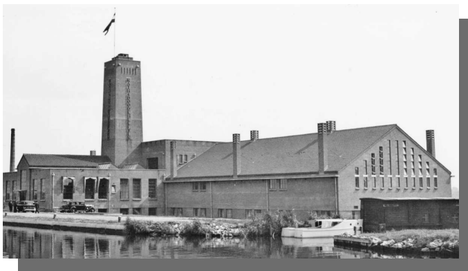
Fabriek van Rath en Doodeheefver in 1936