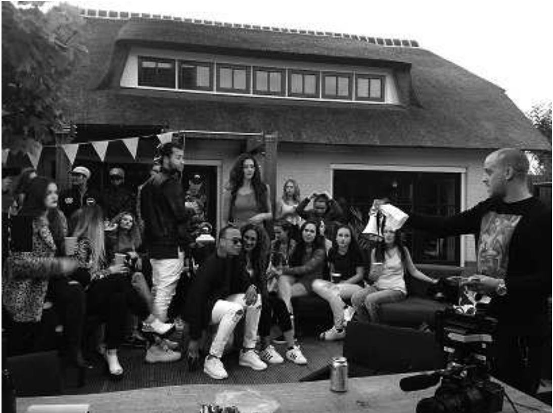
Figuranten en artiesten tijdens de opnamen van een video clip