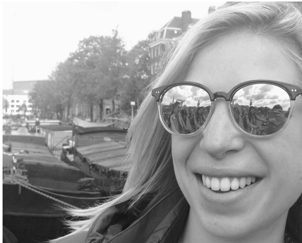
Een figurantenbegeleidster op de set in Amsterdam