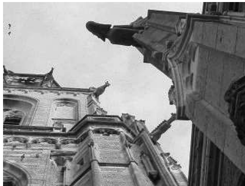
afb. 1 Cunerakerk Rhenen

Het zijn gedecoreerde afvoergoten, bouwkundige onderdelen die bizar gevormde ornamenten zijn geworden.