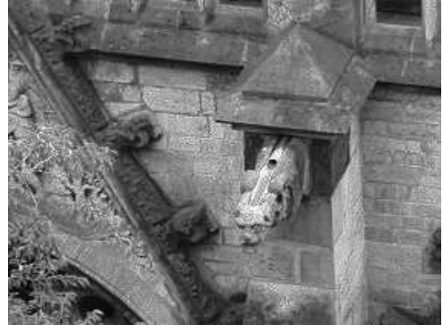
afb. 5 en afb. 6 Domkerk Utrecht

De architecten van die tijd wisten dat hoe beter je de af te voeren waterstroom verspreidt, hoe meer je potentiële schade aan een gebouw voorkomt.