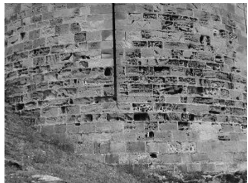
afb. 7 en afb. 8 steenerosie chateau de Najac Fr