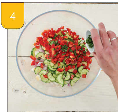
4 Voeg de kruiden toe