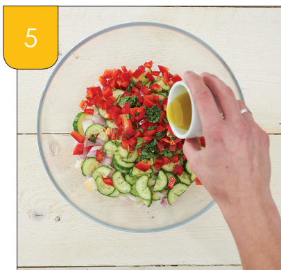
5 Voeg de olijfolie toe