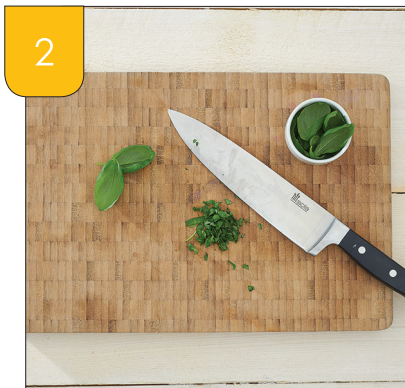
2 Snijd de kruiden klein