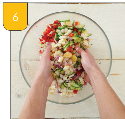
6 Voeg het brood toe en meng alles samen