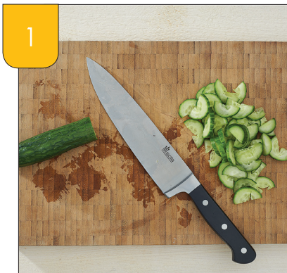
1 Snijd de groenten klein