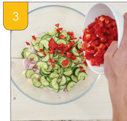
3 Voeg de groenten toe