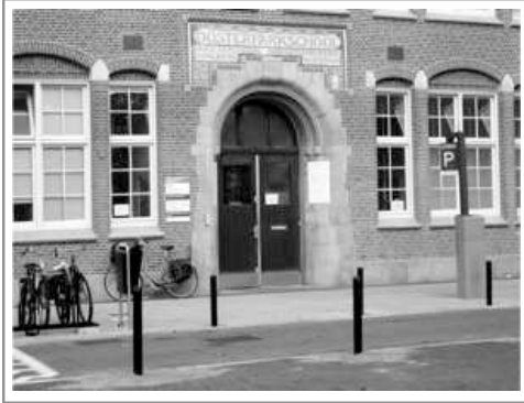
De gereformeerde Oosterparkschool

De lagere school waar alle kinderen van Rijnbach naar toe gingen was de gereformeerde Oosterparkschool op het 's Gravesandeplein