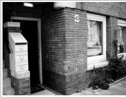
Christiaan de Wetstraat

Wij woonden in de Christiaan de Wetstraat in de Transvaalbuurt in Amsterdam Oost. De Transvaalbuurt was een vrij nieuwe buurt gelegen tussen Tugelaweg, Middenweg en Ringvaart. Achter de