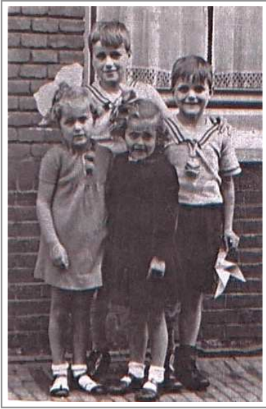
Dit is een foto van ons vieren weer iets ouder

Frieman. Er waren heel veel grote gezinnen, dat was vrij normaal in die tijd. We speelden toch vooral met kinderen uit de protestante hoek. Met katholieke kinderen en niet-gelovigen speelde je niet, die speelden ook niet met ons maar met elkaar. In die tijd was dat nog strikt gescheiden. Dat gold ook voor de school waar je naar toe ging.