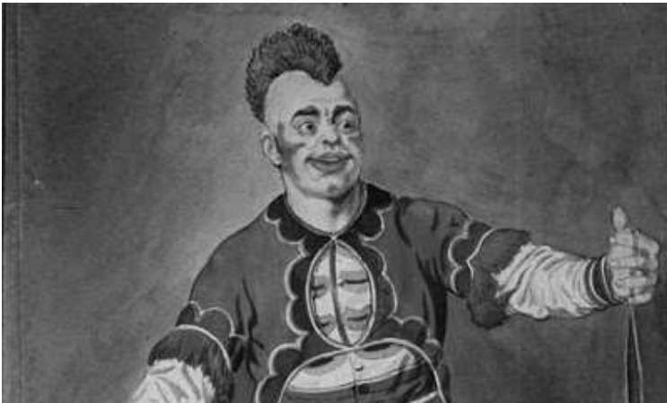
Joseph Grimaldi als clown in 'Mother Goose' in 1807.

In de tijd van de stomme film ontstond de tramp-clown. Deze was een solist en stelde een romantische, gevoelige maar leuke vagebond voor. Joris Janssen stond met zijn naamloze vagebond met het kleine bolhoedje aan de wieg van het genre, maar men noemt ook Otto Grielberg als de eerste vagebonderende clown.