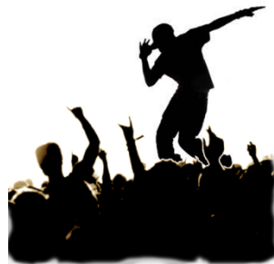
Talent 'prêt à l'emploi'