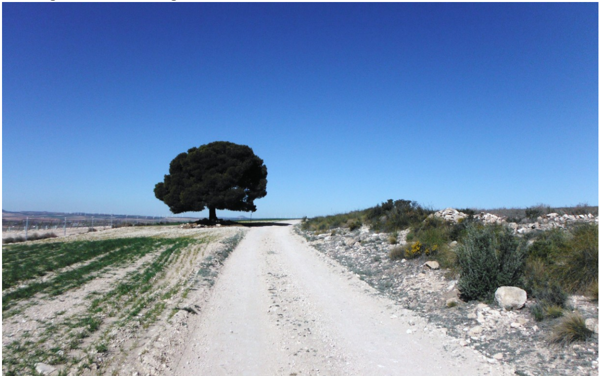
Een eenzame pinus bevestigt de leegte van La Mancha

- La Ruta de la Lana, Guía del Peregrino a S. de C. , ISBN: 8493070602. Het stamt al uit 1999 en begint de beschrijving (pas) in Monteagudo de las Salinas, 38 km voor Cuenca, de Ruta de la Lana II genoemd in sommige informatiebronnen.