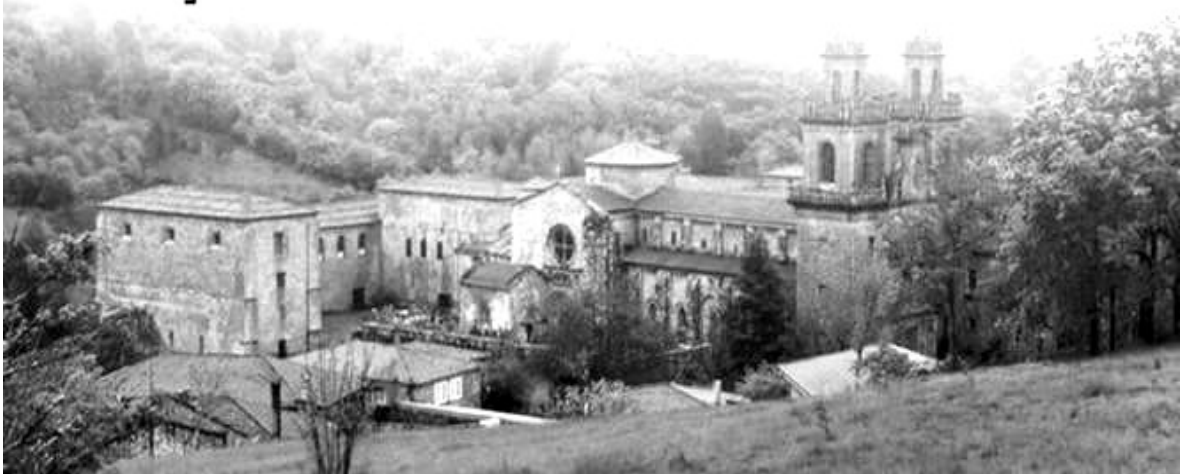
Monasterio de Oseira