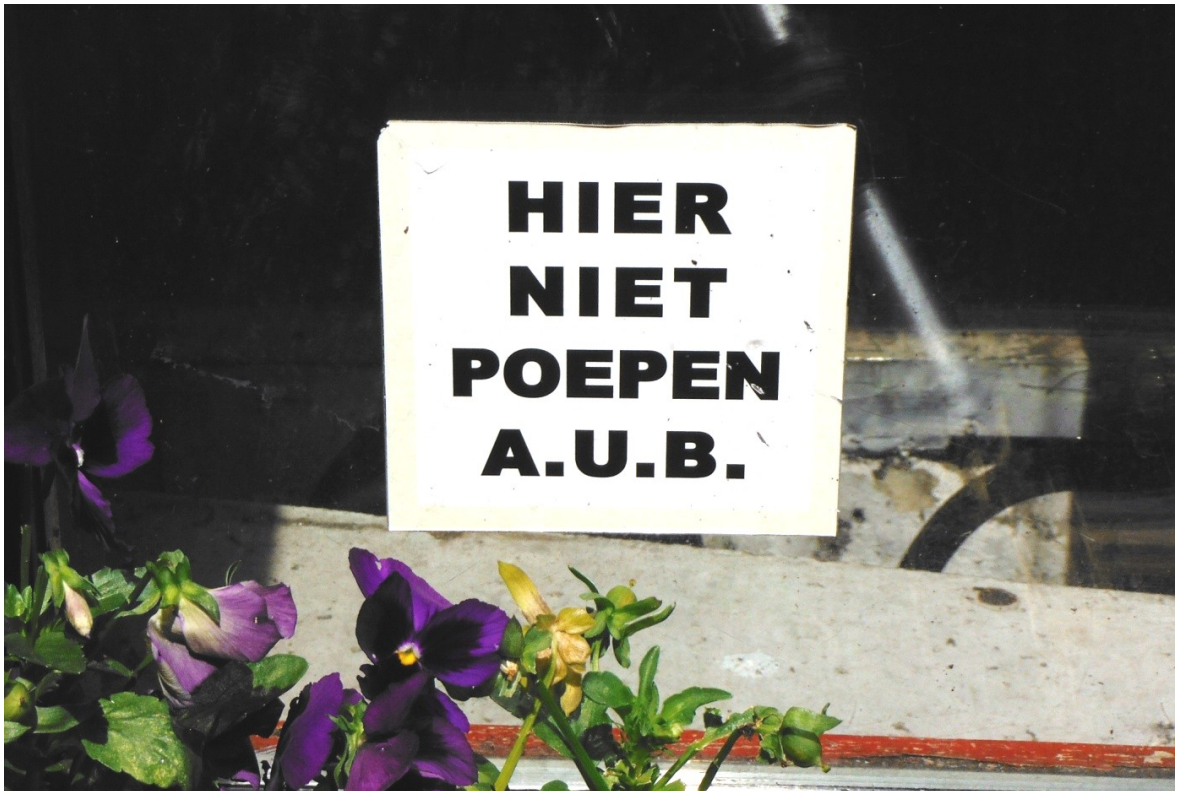
Vriendelijk verzoek op een raam