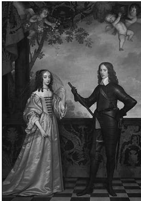
Willem III en Mary II Stuart.

In het rampjaar 1672 was Willem III aangetreden als stadhouder van de Nederlanden. Door zijn huwelijk in 1677 met de Engelse prinses Maria Stuart II, dochter van de katholieke koning Jacobus II, werd hij na de Glorious Revolution in 1688-89 een zeer belangrijk vorst binnen Europa. Vanaf 1689 was hij koning van Groot-Brittannië, waardoor twee belangrijke zeevarende mogendheden nauw met elkaar verbonden raakten. Willem III werd zo een invloedrijke speler binnen de Europese machtsverhoudingen. Hij wist te voorkomen dat het naar hegemonie strevende Frankrijk ongeremd zijn gang kon gaan.