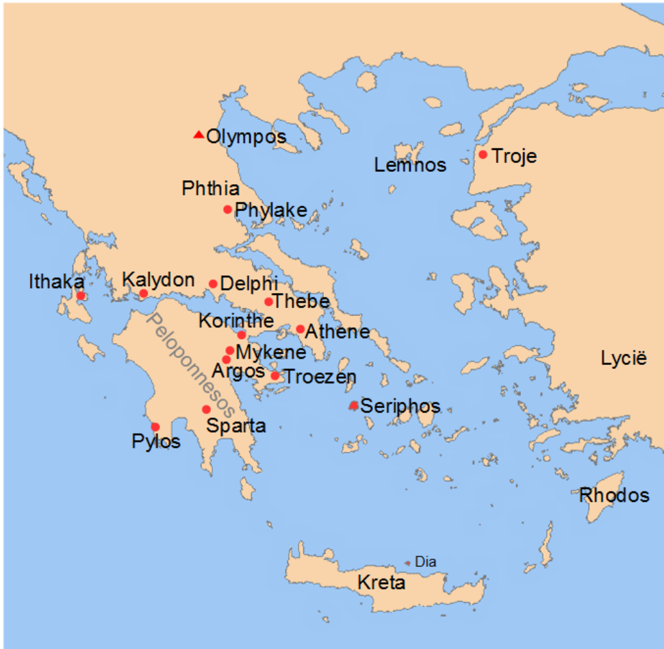
Figuur 2: De voornaamste plaatsnamen in de oudste Griekse verhalen.

ook enkele begrippen en de nodige achtergrondkennis te worden besproken. Dat gebeurt in het volgende hoofdstuk.