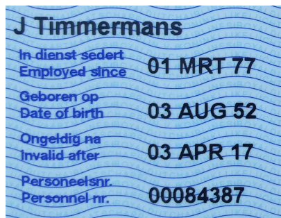
Figuur 2 – Het gegevensdeel van mijn KLM-pas