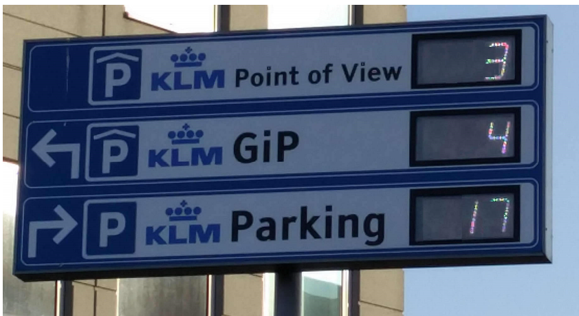
Figuur 1 – Parkeren (na) PoV