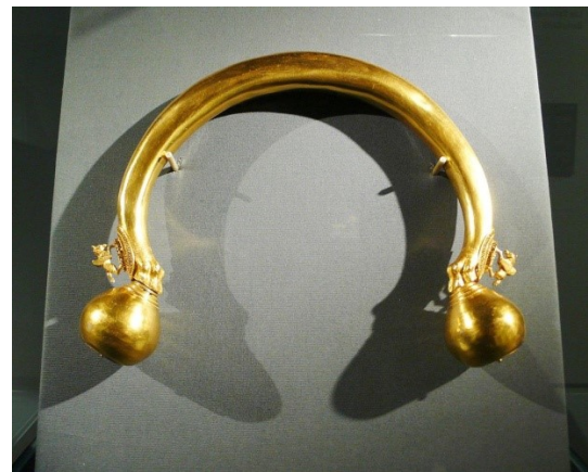
Gouden diadeem van Vix