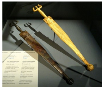
Dolken uit Hochdorf