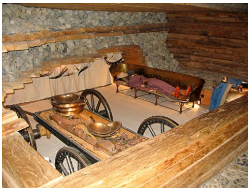
Reconstructie van het graf onder de ...