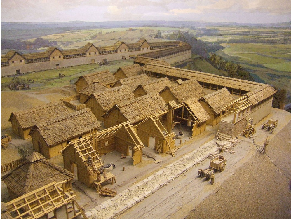
De Heuneburg (maquette)