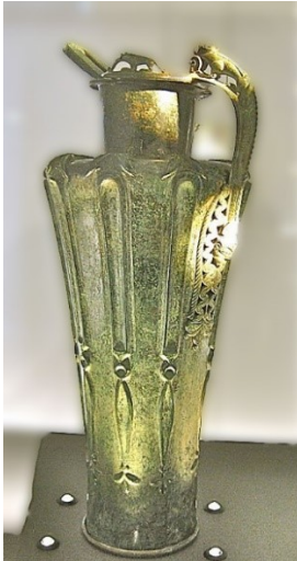
Snavelkan van Dürnnberg