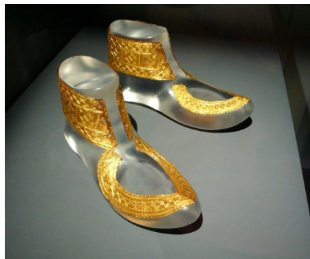
Gouden schoenbeslag in Hochdorf