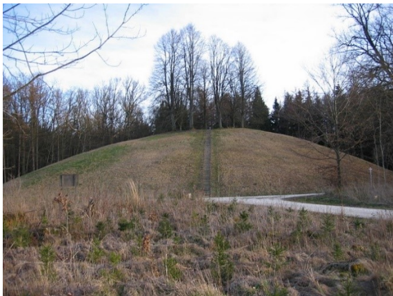
Hochmichele, grootste grafheuvel bij de Heuneburg