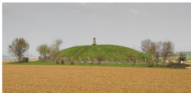
grafheuvel van Hochdorf