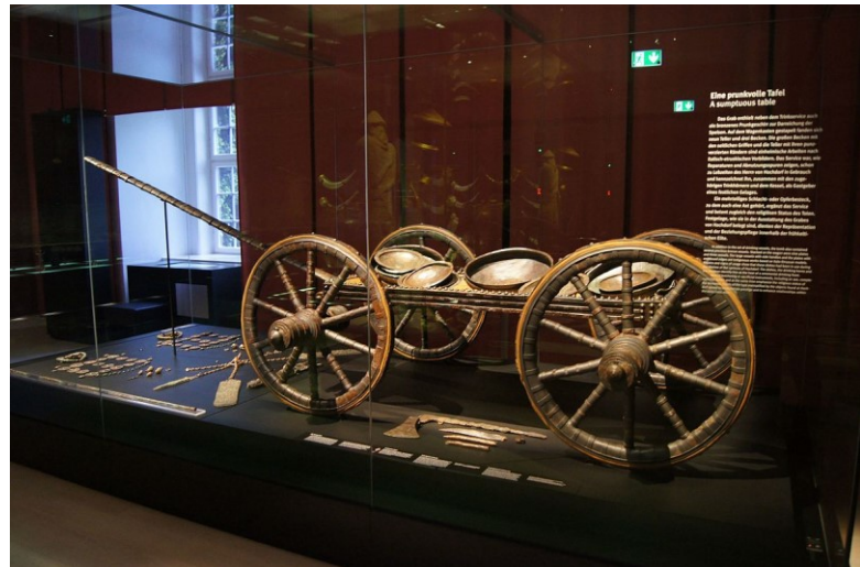
Praalwagen met offerbestek, Baden Württemberg