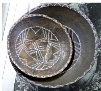
Aarden huisraad uit graf nr. 11 te Kelheim