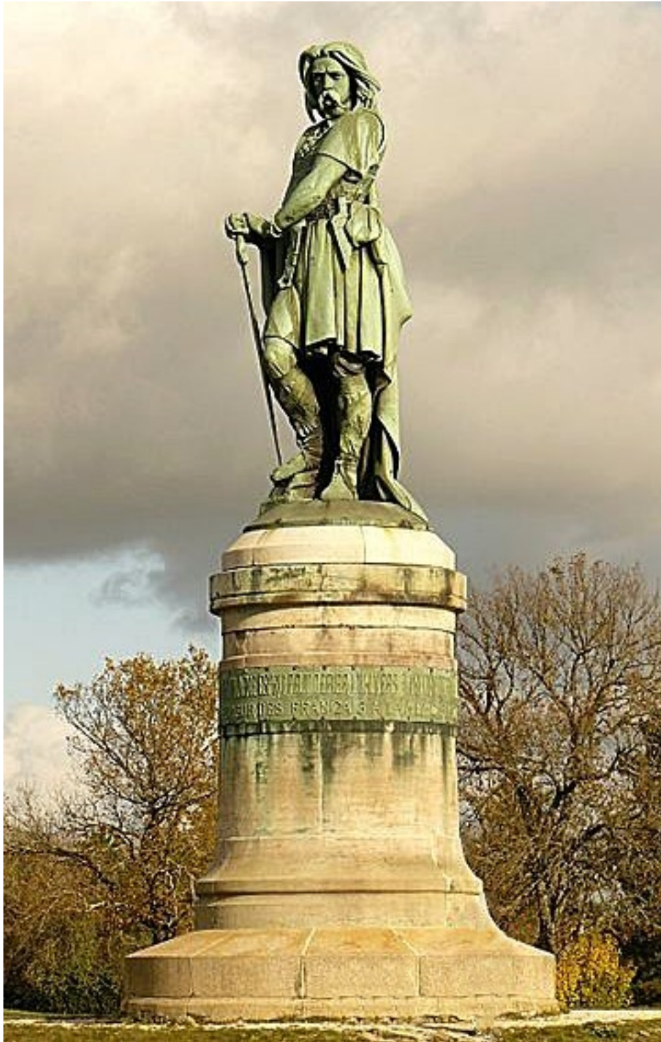
Vercingetorix in Alesia