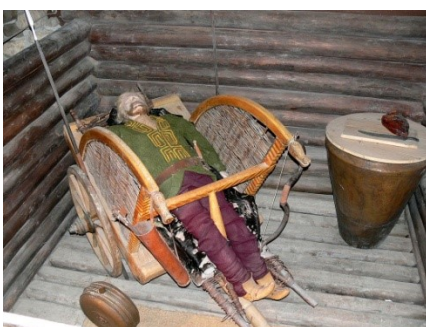
Vorstengraf in Dürnnberg