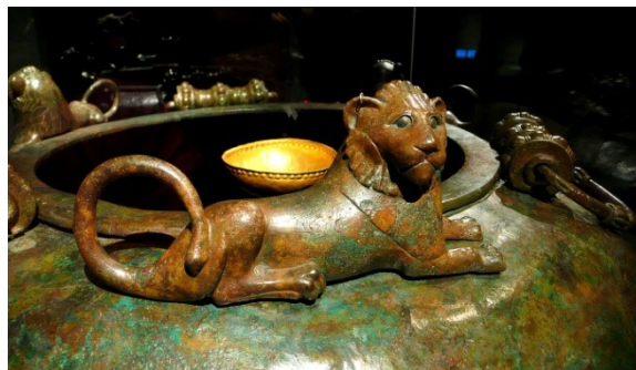
Bronzen vat uit Hochdorf