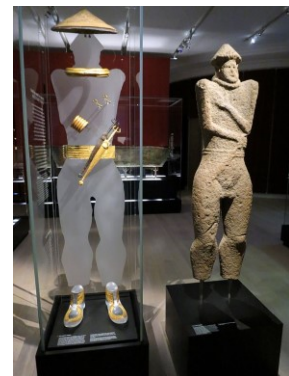
Standbeeld op grafheuvel van Hirschlanden