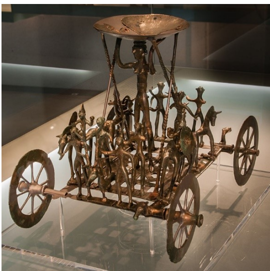
Wagen van Strettweg.

Het klimaat was toen al erg verslechterd, kouder en natter, en is wellicht een factor geweest voor de vele migraties. We kunnen stellen dat de urnenveldcultuur, die