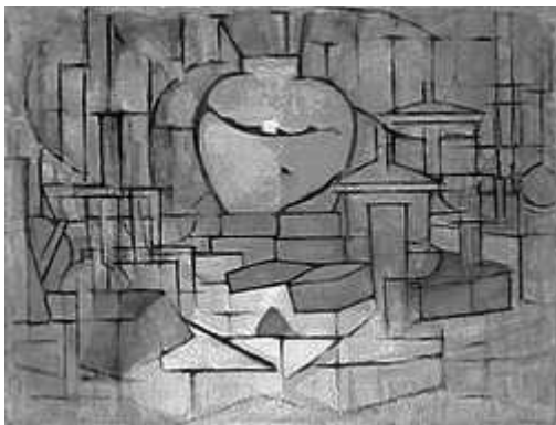
Eentje van Piet Mondriaan. Stilleven met gemberpot II, 1912 Ontzettend kubistisch.

Oké, een goed begin is het halve werk. Dit betekent niet dat hierna nog maar één gedicht komt.