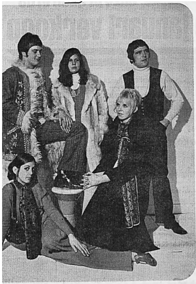
Mode jaren 70

Ieder gelijkenis van figuren en situaties berust op een gelukkig of ongelukkig toeval.