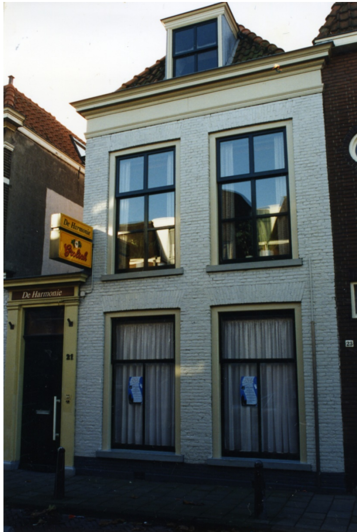
Jongeren centrum `De Moksha`