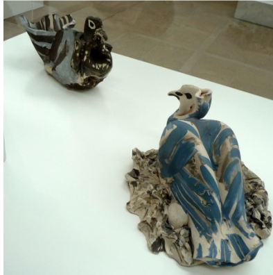
Duiven uit 1953, keramiek

Over Picasso gaat het verhaal dat zijn vader hem vroeg -hij was toen nog een jongen- de duiven in het schilderij waar hij mee bezig was, verder uit te werken. Hij moest zelf even iets anders doen. De vader was ook kunstschilder en meer dan bekend met het schilderen van deze vogel. Toch vertrouwde hij dit werkje aan zijn zoon toe. Bij terugkeer bleken de duiven van zoonlief aanzienlijk beter te zijn uitgevallen dan die van hemzelf. Een veel belovende zoon, die Pablo, maar dat wist de vader natuurlijk al.