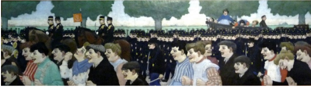
Uittocht van de Genie naar het kamp, 1911

bij elkaar. Dit schilderij, bijvoorbeeld, nog volledig figuratief, in zijn volle breedte: