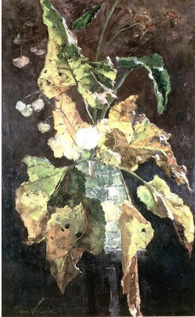
Floris Verster, Bloemen en blaren , 1888

ceerde Jan Toorop hem bij de avantgardistische kunstenaarsgroepering Les Vingts in Brussel. Daar exposeerde hij nog in datzelfde jaar'.