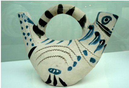
Duif, 1954, keramiek

heel klein gedeelte daaruit) van Picasso te kijken. Aan het werken met klei begon hij pas op latere leeftijd, na er op zeker moment door geboeid te zijn geraakt. Prompt liep het aantal kunstwerken en -werkjes op tot een paar duizend, werd er zelfs fabrieksmatig in series gewerkt, maar was het tenslotte allemaal afkomstig van de meester!