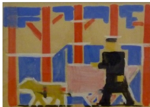
Studie voor Compositie 1917, Nr. 1 (Hondenkar), 1917, gouache op papier

De figuren zijn bij Van der Leek eenvoudig en gestileerd, zijn kleuren helder en veelal primair. Het is daarom dat hij opviel bij Mondriaan (1916) en Van Doesburg en dat hij zich aansloot bij de nieuwe kunstbeweging. Zijn abstrahering van de werkelijkheid bleek zelfs een stimulans voor de anderen in de beweging, die daar uiteindelijk toch consequenter in bleken te zijn. Na artistiek verschil van inzicht en nog het een en ander verliet Van der Leek in 1918 de club alweer, om opnieuw figuratief verder te gaan. Tenslotte, zo voelt het aan als ik zijn werk bekijk, paste hem dat toch beter. Een voorbeeld van wat ik krampachtig of liever 'gekunsteld' zou willen noemen, kwam ik tegen in een van de tentoonstellingszalen. Het betrof hier de abstrahering van een man met een hondenkar die een huizenblok passeert. Dit beeld moest hoe dan ook tot lijnen en blokjes worden teruggebracht, geheel naar de inzichten van de beweging: