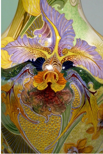
met de hand beschilderde vaas, floraal gedecoreerd (detail) - Plateelbakkerij Zuid-Holland