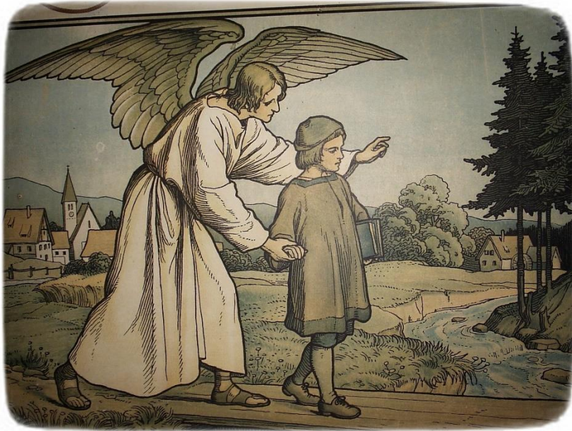
TWEEDE ENGEL-ONTMOETING 1962