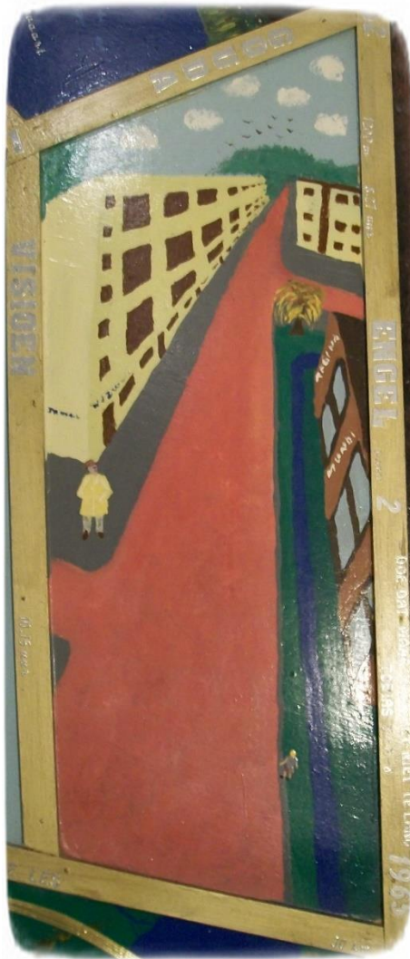
Tobith 5:8 Doe dat, maar maak het niet te lang