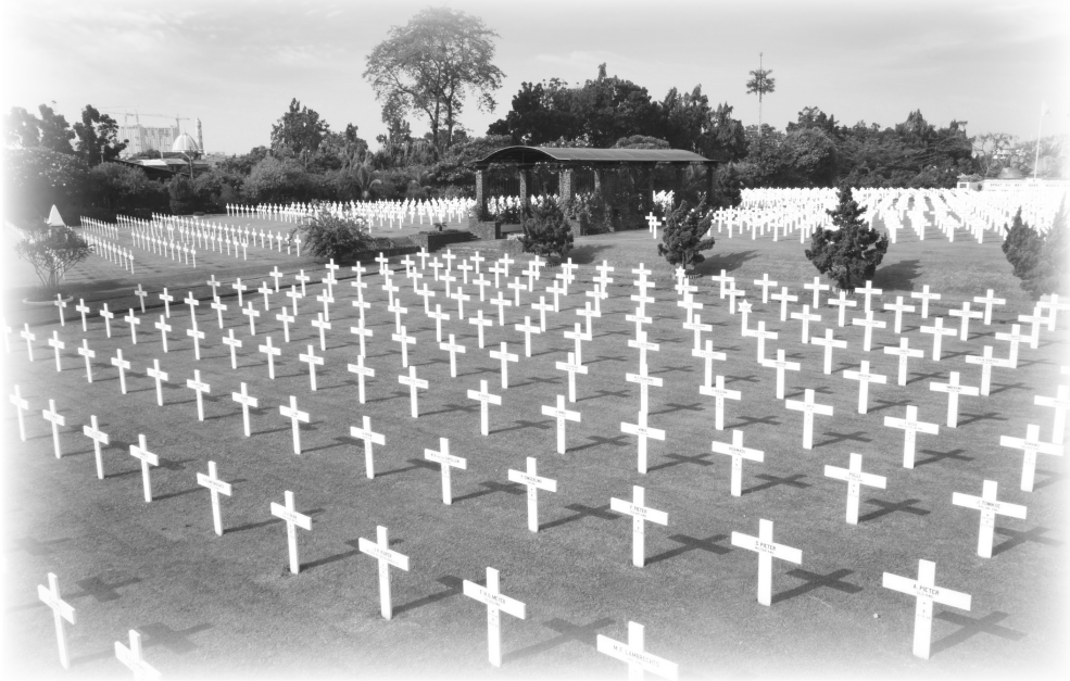
Het ereveld Menteng Pulo - Batavia

Meer dan 6400 omgekomen kameraden moesten we in Indië achter laten. Met een bedroefd gevoel vertrokken we weer naar de kazerne.