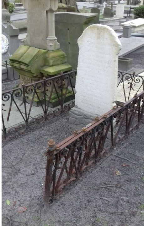
Familiegraf – Haagse familie Ragut Oud Eik en Duinen te Den Haag

Haagse en Zeeuwse families maar het is wel opvallend dat leden van beide families verbonden zijn met Nederlands Indië en dat er veel (KNIL) militairen voorkomen in beide families. De familie Haccou was een bekende familie in Ned. Indië en de zwager van Willem Ragut was resident in Ned. Indië.