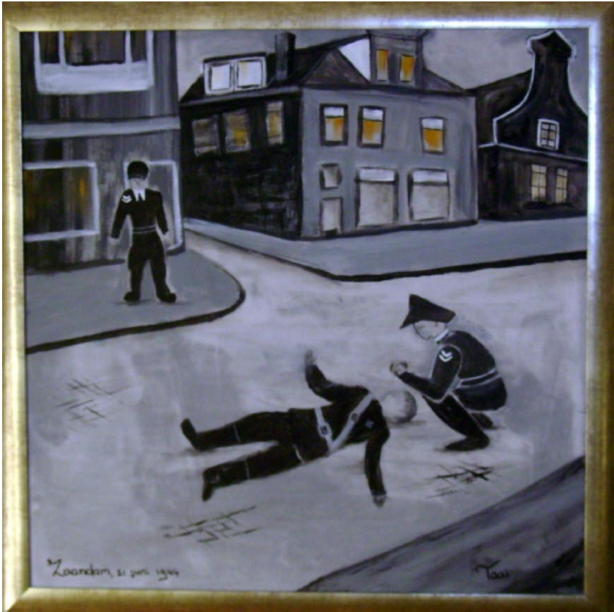
Schilderij van Henk Taai: "De aanslag op Ragut"