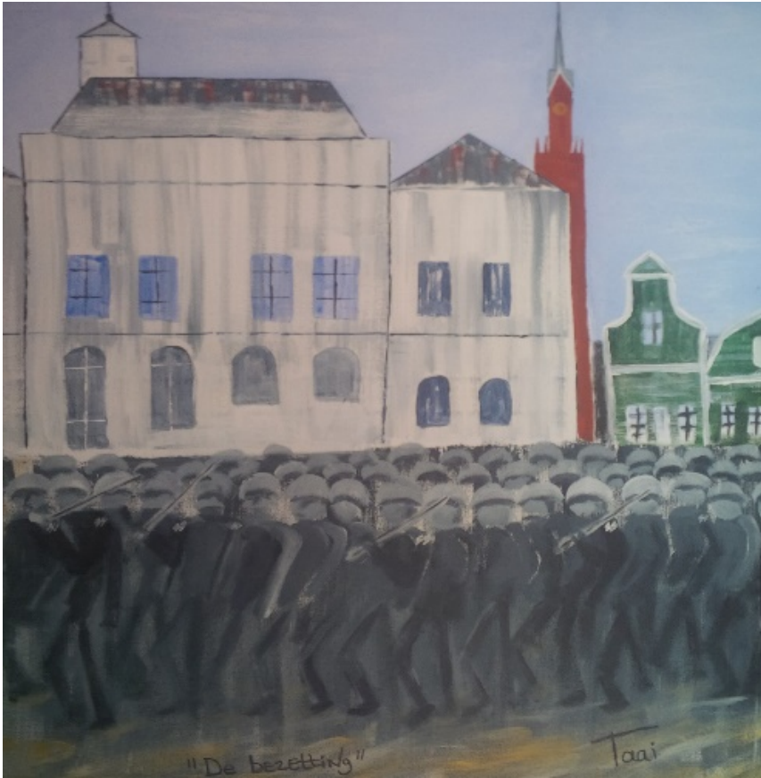
Schilderij van Henk Taai: “De bezetting”