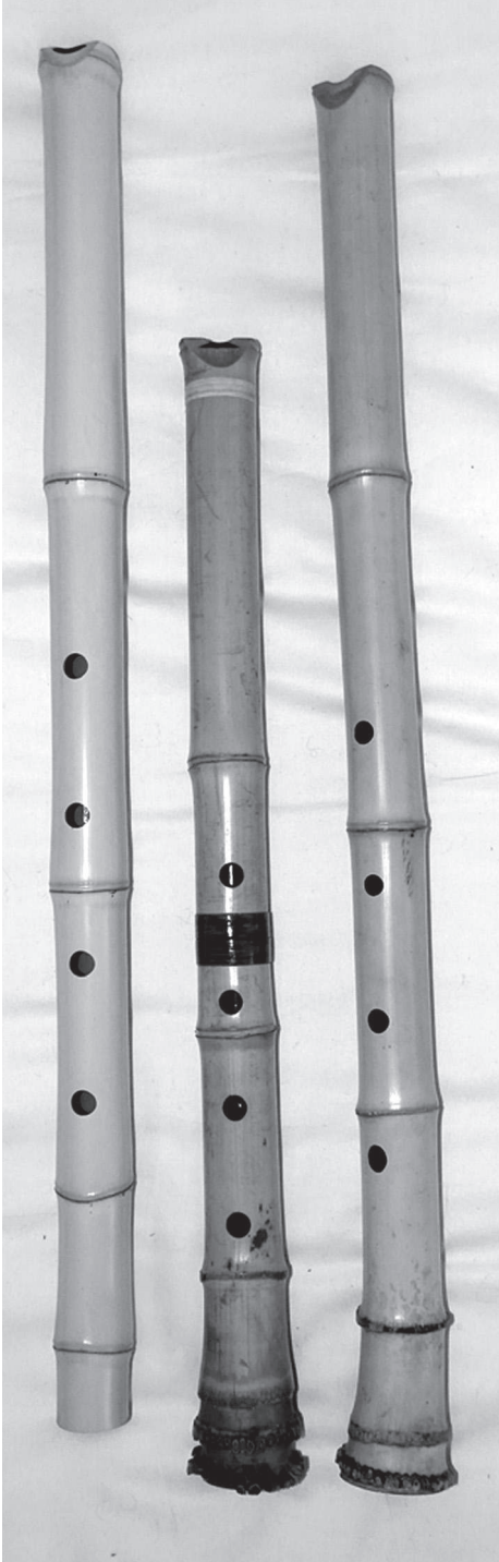
Afb. 1. Drie soorten shakuhachi. V.l.n.r. Jinashi fluit zonder root- end en met ingelegde utaguchi. Jinuri fluit met rootend en ingeleg- de utaguchi. Jinashi fluit met root- end en zonder ingelegde utaguchi. De middelste fluit is een moderne shakuhachi in d, bestaande uit twee delen.