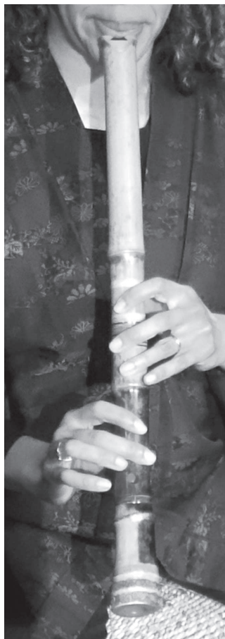
Afb. 2. De speelhouding.

de toon te verhogen of te verlagen, dan krijg je bij een in D gestemde shakuhachi als toonladder: d, f, g, a, c, d.