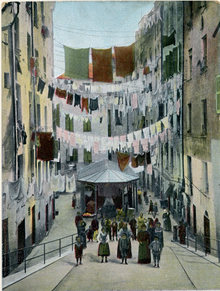
GENOVA 29 Sept. I Truogoli di S. Brigida

Lieve Mieke. Goo kien de Italiaanske spaten waar Addienge Dodo langt rede, er yu uit, wel raar ke. Onke boof leek al keurig daarvoor sturen we ook een tip van 't Hofter waru en moor twee Dag. Gaveling van Loes van trite Addie