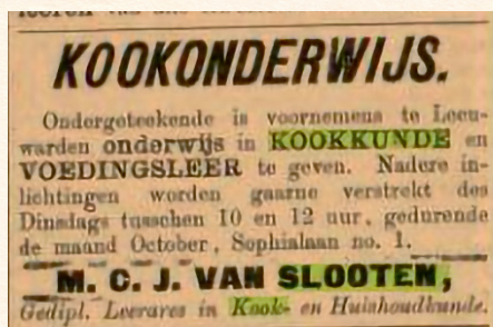
Advertentie Leeuwarder Courant 2 oktober 1900

De weg stond nu vrij om lerares in Leeuwarden te worden, een bijzondere en moedige stap om in die tijd en in haar sociale omstandigheden een eigen werkkring te organiseren. De modern denkende Jo had zich hiermee ontworsteld aan het traditionele leven van vrouwen van haar stand. In haar autobiografie schreef ze dan ook triomfantelijk dat een leven van handwerkjes maken, pianospelen, tennissen en liefdadigheid voorbij was. Met een lening van haar vader huurde ze een benedenhuis in Leeuwarden waar ze kon lesgeven. Vervolgens zette ze in de Leeuwarder Courant van 2 oktober 1900 een advertentie waarin lessen kookkunde en voedingsleer werden aangeboden. Dames betaalden het volle pond, voor dienstbodes gold gereduceerd tarief. (Jo was er naderhand trots op het geleende geld aan haar vader te kunnen terugbetalen, kort voor zijn dood op 28 maart 1902.) Als symbool van Jo's nieuwe paradigma hing in de leskamer een feministische affiche waarop arbeid voor vrouwen werd geëist.