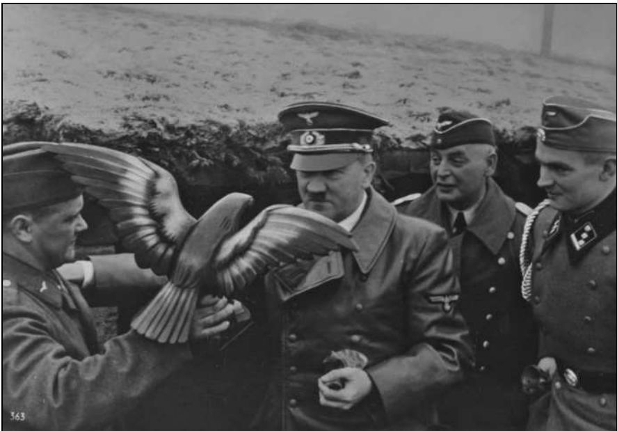
Hitler neemt een uit hout gesneden adelaar in ontvangst.