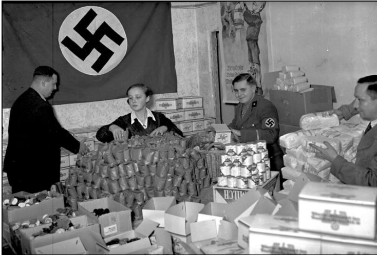
Vrijwilligers vullen kerstpakketten in het kader van het Winterhilfswerk. Berlijn, december 1935.

toe. Met dit alles werd een beeld uitgestraald van solidariteit en voorspoed, die de nazi's na lange jaren van politieke en economische verdeeldheid tot stand hadden gebracht.