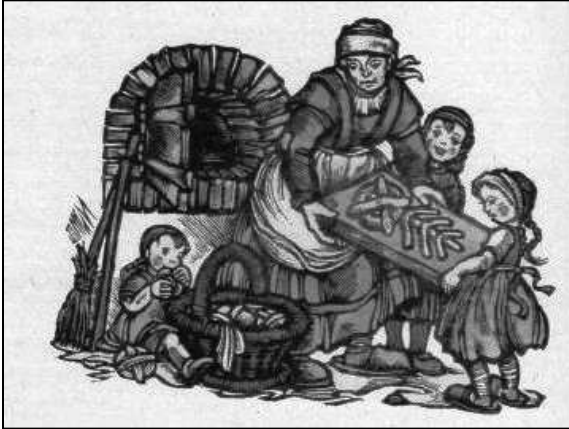
Vorbereidingen voor kerst: een moeder bakt lekkernijen in Germaanse vormen.

De baksels die moeders vanouds met Kerstmis voor hun gezin maakten ontsnapten evenmin aan nazidirectieven. 'In elke hoeve wordt met kerst gelegenhedenbrood [ Gebildbrot ] gebakken', zo werd verkondigd in een propagandajournaal uit 1937. 'Ook dit heeft een diepe, symbolische betekenis. Of het nu de ruiter is, de wilde jager of het zonnewiel of de haan die