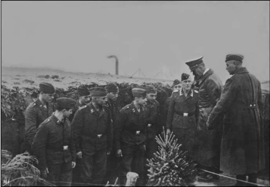
Hitler bezoekt zijn troepen aan het Westfront.