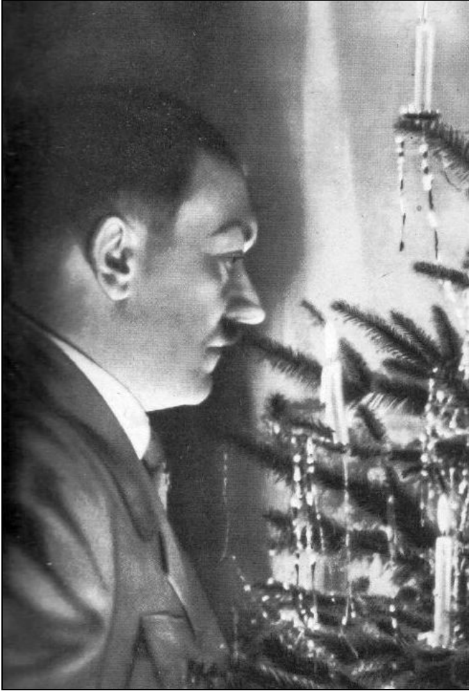
Adolf Hitler bij de kerstboom: geen vanzelfsprekende combinatie.