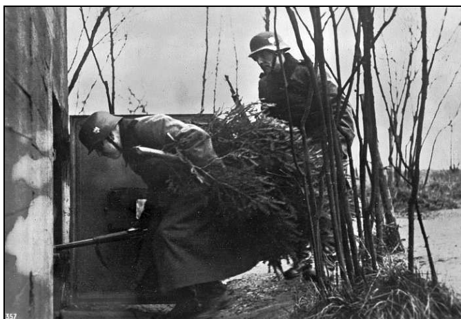
Duitse soldaten sjouwen een kerstboom hun bunker in.

Niet Mickey Mouse, maar de oorlog zorgde ervoor dat Hitler Kerstmis in 1939 minder gedeprimeerd doorbracht. De oorlog was met de kerstdagen in een relatief luwe periode beland. Polen was het afgelopen najaar niet opgewassen gebleken tegen de Duitse Blitzkrieg en had begin oktober gecapituleerd waarna een wrede bezetting begon, ook in Oost-Polen waar op 17 september het Rode Leger binnengevallen was. Op 3 september 1939 hadden Groot-Brittannië en Frankrijk Duitsland de oorlog verklaard, maar het aantal gewapende conflicten was beperkt gebleven, waardoor de Britten spraken van een 'Phoney War' (nepoorlog), de Fransen van een 'drôle de guerre' (lolle oorlog) en de Duitsers van een 'Sitzkrieg' (zittende oorlog).