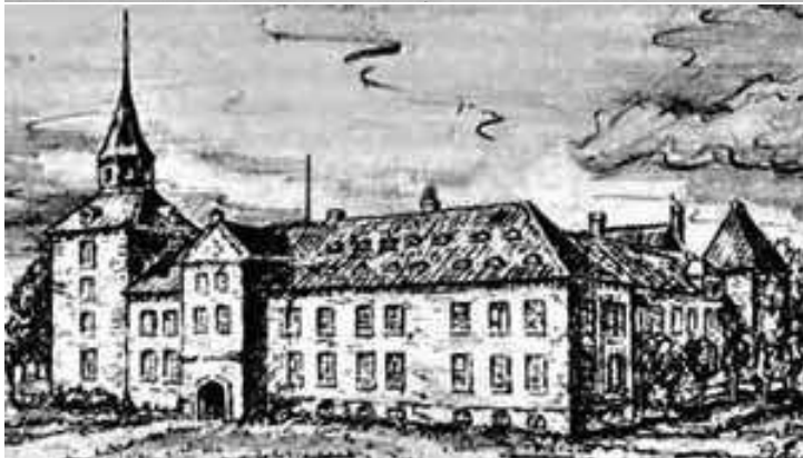
Afbeelding 1.4 Boven: De stad Aurich rond het jaar 1740. Aan de linkerkant van het plaatsje is het hof zichtbaar. Onder: Gravure van het Auricher hof.