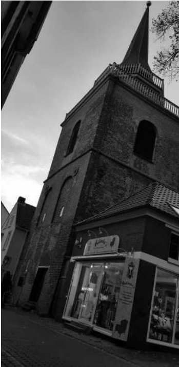
Afbeelding 1.5 Toren van de Lamberti-kerk in Aurich.

vuurwerk de lucht in dat de initialen van de vorstin in de lucht schreef. De hoofdprijs van dit spel was een verguld geweer.