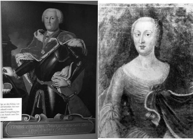
Afbeelding 1.3 Vorst Carl Edzard (links) en diens echtgenote, vorstin Sophie Wilhelmine von Brandenburg-Bayreuth van Oostfriesland.