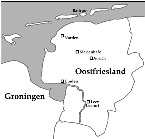
Afbeelding 1.1 Oostfriesland.

en Nederland was Oostfriesland sinds de Middeleeuwen een onderdeel van het Heilige Roomse Rijk geweest. Dat bestond al sinds de tiende eeuw, en was al door Karel de Grote gesticht. Het was onderverdeeld in talloze onafhankelijke vorstendommen en graafschappen. Oostfriesland stond toen met taal, godsdienst en cultuur veel dichterbij Groningen en Friesland dan bij de rest van wat nu Duitsland heet. Dat gold ook voor het bestuur. In de rest van het Rijk was het bestuur en de maatschappij feodaal, met een bevolking die in drie standen was onderverdeeld: hertogen, leenheren en horigen.