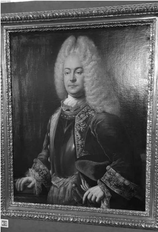
Afbeelding 1.2 Vorst Georg Albrecht van Oostfriesland.

Oostfriesland 2500 mensen. Na de vloed besloot vorst Georg Albrecht (1708-1734), van wie een portretschilderij in afbeelding 1.2 te zien is, tot een belastingverhoging om de reparatieschade te kunnen repareren. De standen kwamen tegen deze belastingverhoging in verzet, want zij wilden zelf met extra belastingverhoging de reparaties uitvoeren. Zo begon onder leiding van Heinrich von dem Appelle, die op dat moment de ridderlijke stand vertegenwoordigde, de zogenaamde Appellestrijd (Appelle-Krieg). De opstandige steden verenigden zich en vormden de zogenaamde renitenten. De strijd onttaardde snel in een burgeroorlog.