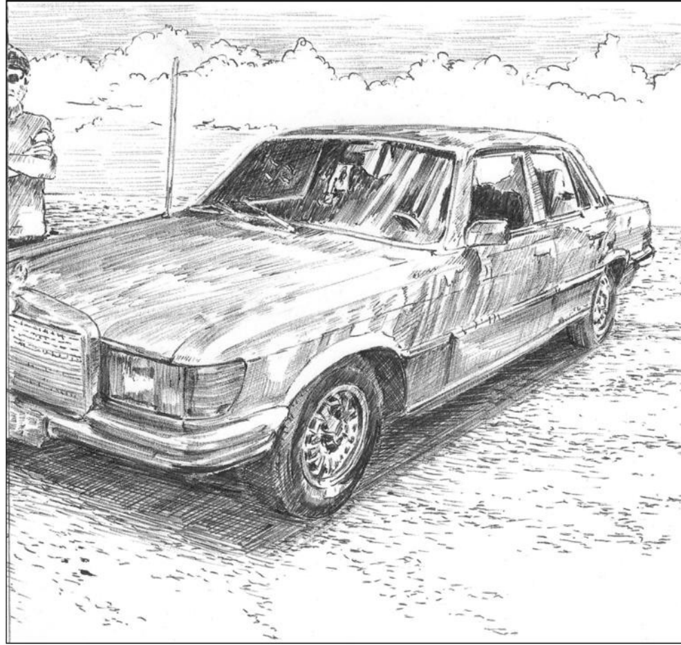
Me and my car 2