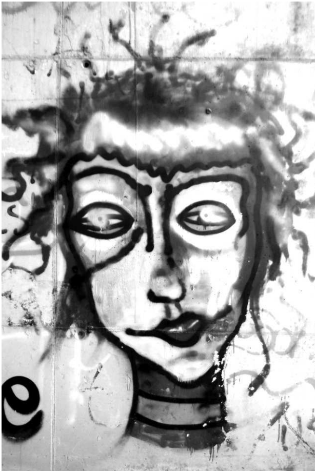
Carnavaleske graffiti onder een Spaans viaduct

De Bonte Storm heeft de wind niet mee, maar zwaar tegen op maandag 8 februari en wordt al bij voorbaat van de weg geblazen. Geen optocht in diverse plaatsen, omdat er zwaar weer voorspeld is. Je zult maar maandenlang gewerkt hebben aan een praalwagen of een ander carnavalsknutselwerk. Gelukkig is carnaval het feest van het grote relativeren. Voor een optocht in Roermond met halfvasten blijkt weinig of geen animo.