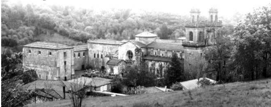
Monasterio de Oseira. Een van de foto's bij het artikel in Vruchtbare Aarde