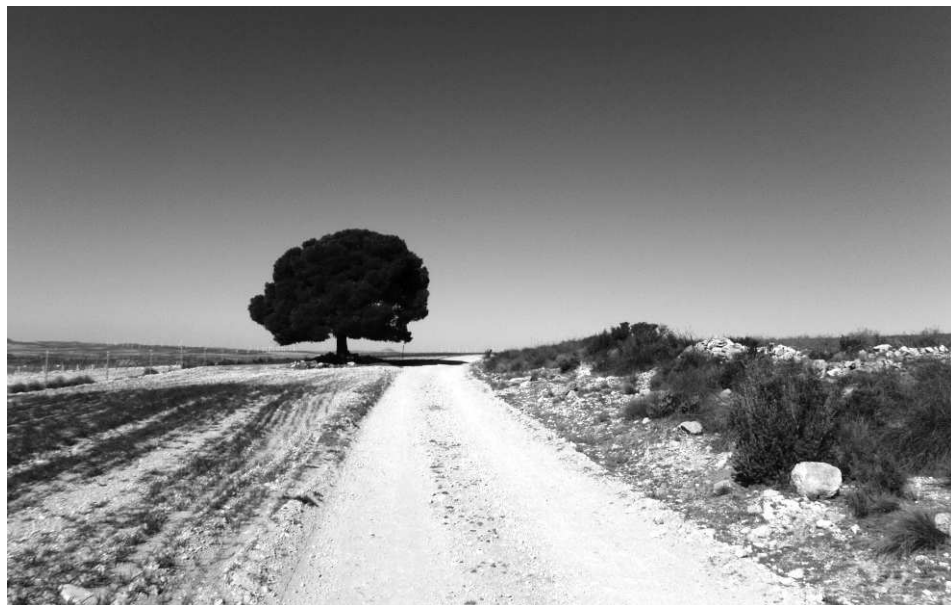
Een eenzame pinus bevestigt de leegte van La Mancha

Voor de geïnteresseerde lezer kan ik lijstjes met overnachtingsadressen van beide Camino's doormailen. Voor mogelijke wijzigingen kan ik niet instaan. Mijn mailadres staat voor in dit boek (blz. 4).