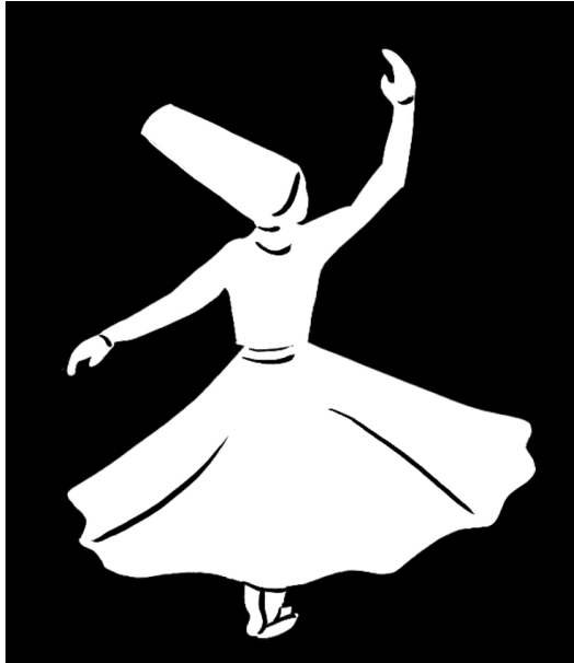
Dansen in het duister.

Ik hou van spiritualiteit die licht maakt en lucht geeft.