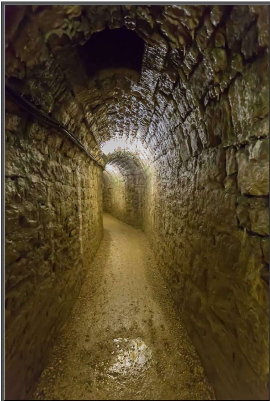
Voor de Hemel komt De Hel/Gemengde Gevoelens Twee