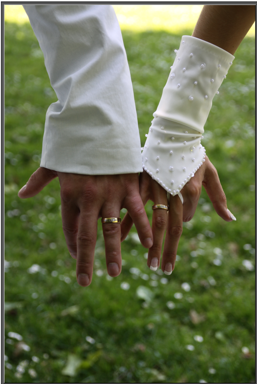
De Vervaldatum/Gemengde Gevoelens Twee