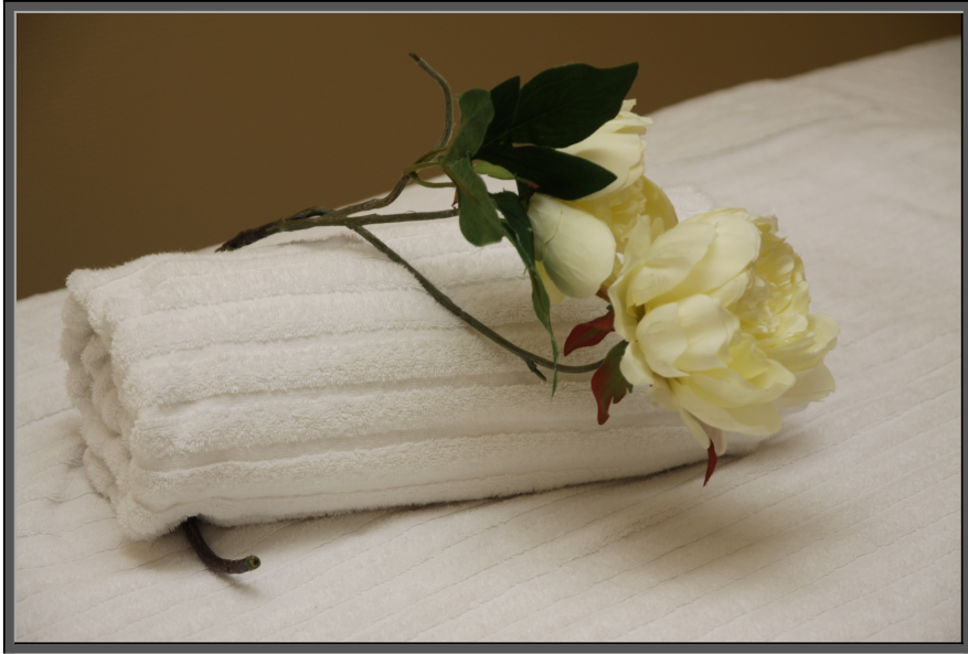
De Vergeetput/Gemengde Gevoelens Twee

Daar is nou toevallig ook een oplossing voor.