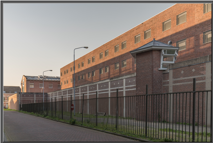
Zeventien Jaar/Gemengde Gevoelens Twee/photography by Ria Beken

Inderdaad, zeventien jaar heb je moeten doorbrengen tussen mensen van verschillende nationaliteiten en beladen met alle zonden van de wereld.