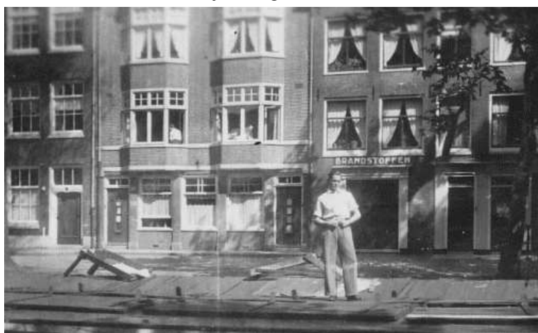
HET HUIS WAAR IK GEBOREN BEN.

Wat een vreemd idee, het ziet er zo rustig en vredig uit. De oorlog was voorbij. Als oorlog, maar niet voor de slachtoffers, onvoorstelbaar de man in de linker erker, mijn vader 31. Hij had jaren KZ achter de rug, mijn moeder 28 en wel haar man en kinderen, maar de rest heeft de SHOAH niet overleefd. Opeens klinkt Manja en klinieken meer dan logisch