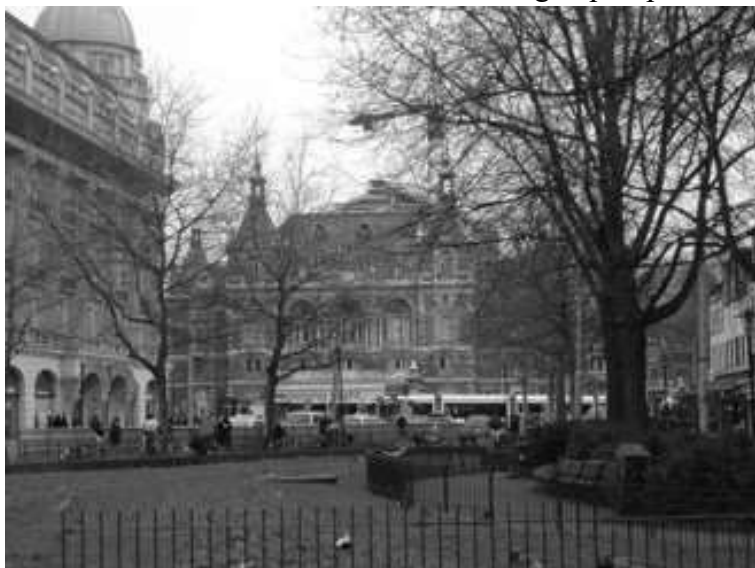
Een foto vanuit ons huis, Lijnbaansgracht 250 I, Amsterdam.

De ongewenste baby uit een depressieve moeder, het stille kindje, haast onzichtbaar de goede leerling, het knappe balletmeisje, maar altijd was er die mysterieuze angst... die veel later manifest zou worden, decennia verder begreep ik pas waarom.