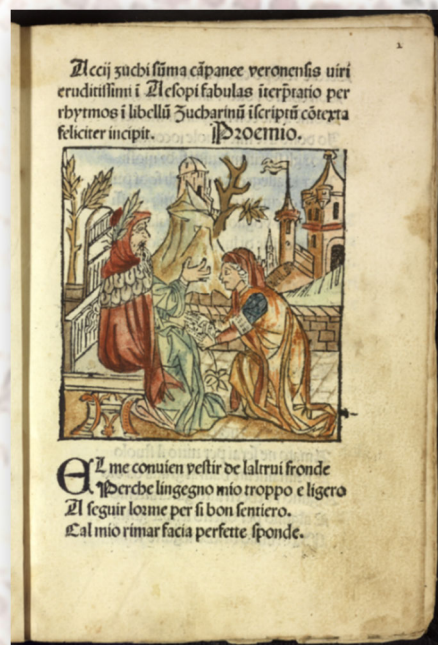
Aesopus moralisatus, 1485 1

De stripjes werden gemaakt met Storyboard en Pixabay.