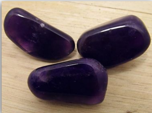
Donkere amethyst trommelstenen

Bij het gebruik van amethyst is de donkere amethyst het meest geschikt.