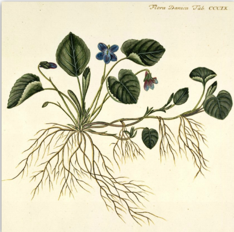
Groeiwijze van het maarts viooltje

Om viooltjes zalf te bereiden gebruikt men: