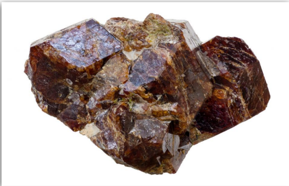
Granaat kristallen op moedergesteente

Het gebied van het eerste chakra-punt kan de cliënt regelmatig zelf masseren met granaat-olie, de toepassing van granaatessentie is in deze gewenst.