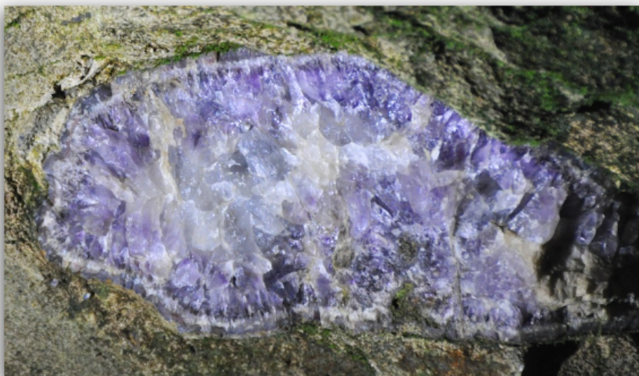
Amethyst in edelsteenmijn Idar-Oberstein

Allereerst dient opgemerkt te worden dat het alles behalve vreemd is dat Hildegard von Bingen veel ervaringen met de amethyst op heeft kunnen doen aangezien deze steen in de (vroege-) middeleeuwen reeds rijkelijk gevonden werd in Idar-Oberstein welke stad slechts op geringe afstand van Disibodenberg ligt.