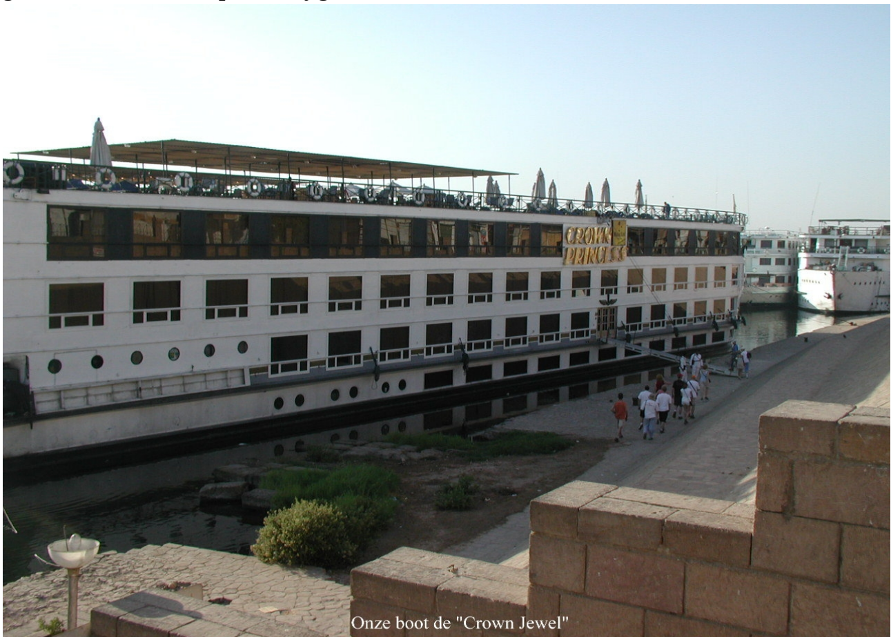
Onze boot de "Crown Jewel"

vermelding van je verblijfplaats. Het visumverzoek met paspoort en postzegels moet je aan de witte pet overhandigen. Een comfortabele bus met airco brengt ons binnen een half uurtje naar het cruiseschip de Crown Jewel die ligt afgemeerd aan een kade in Luxor. Het is niet het enige cruiseschip, er liggen er meerdere. Op deze Crown Jewel gaan we onze Nijlcruise ervaren. Wat mij opvalt is dat de zon bijna van het ene moment op het andere achter de horizon verdwijnt en het ook gelijk aardedonker is. Tientallen gelijksoortige cruiseschepen liggen naast de onze te wachten op de vele toeristen. Terwijl de koffers door de bemanning naar de centrale hal worden gebracht, worden wij bijeengeroepen door onze gids voor de komende dagen. Komt nader tot Nader, zou een vaste kreet worden van de gebruikte en goed Nederlandssprekende gids. Hij heeft een aantal jaren in Amsterdam gewerkt en daardoor spreekt hij goed Nederlands.