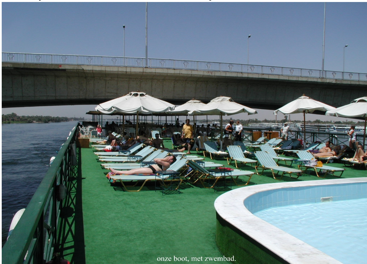
onze boot, met zwembad.

aangevaren. De bootjes lijken op een krant die als een bootje zijn gevouwen. De bootjes zijn felgekleurd en er zit zowaar iemand in en met de handen peddelend proberen ze zo bij onze boot te komen en sommigen zingen of bieden hun handelswaar aan, met de bedoeling wat baksjij (fooi) los te krijgen. In rap tempo vaart onze boot weer terug naar Luxor waar bussen gereed staan om ons naar Hurghada te brengen. Dat is een spektakel omdat de bussen gezamenlijk en onder begeleiding van politie-escorte door de dorre woestijn rijden en daarbij de snelheidslimiet ruimschoots overschrijden.