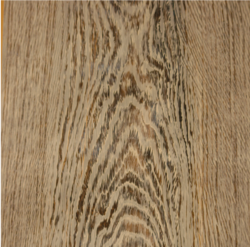
Tekenen van de ronces van eik.

want het was geen sinecure om op die korte zondagochtenden, in een klas met meer dan dertig leerlingen, voldoende begeleiding te genieten. Helaas verliet onze leraar al na enkele weken de Academie. Hij verhuisde naar Duitsland.