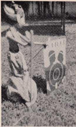
Contact in Indië

bare voorwerpen. Een paar extra schijnwerpers en een lamp achterop is ook geen overbodige luxe.