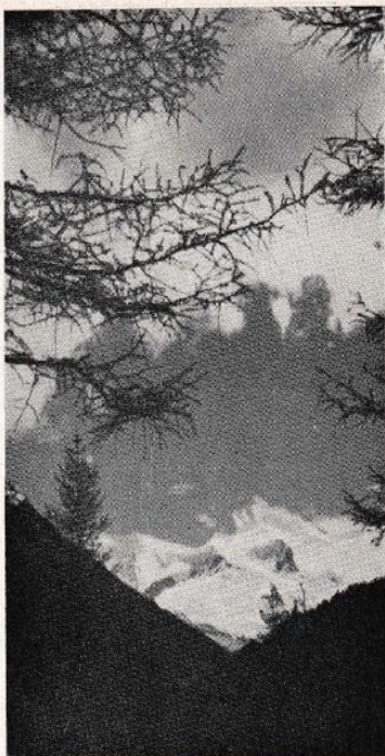
Bergen en Wolken

kaar geschroefd, want U begrijpt op de heenreis dient men zich al van alles en nog wat te oriënteren. Vooraf is het zaak landkaarten te bemachtigen, waarop de route uitgezet wordt. Dan wint men inlichtingen in omtrent toestand der wegen, bergpassen, rivierovergangen enz. enz. En ik wil U wel zeggen, dat de K.N.A.C. (of A.N.W.B.) daarbij veel hulp verleent. Zij is het lichaam dat over veel gegevens, het buitenland betreffend, beschikt.