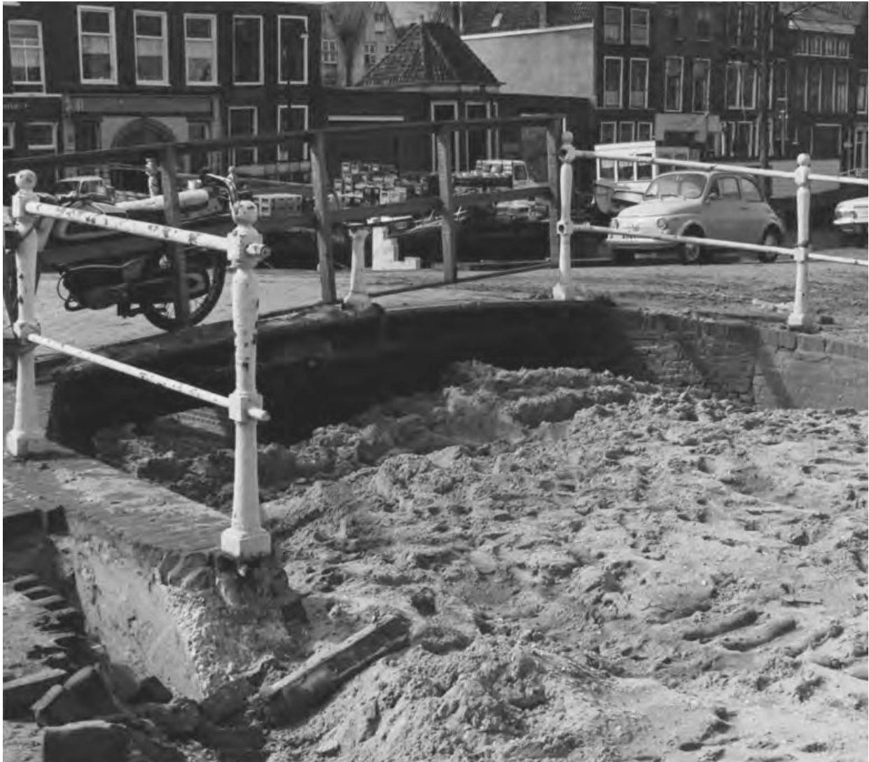
Dempingswerken in Leiden. Waardburg, 1973

Hij keek er even naar. Vast van een student die zich excuseerde voor het feit dat hij door allerlei omstandigheden niet aan de opdracht van deze week toegekomen was.