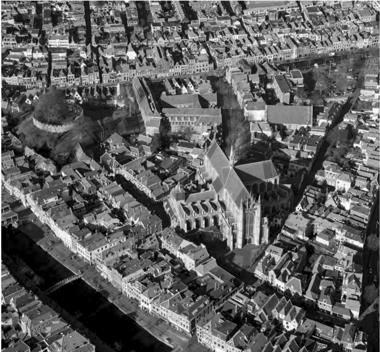
Hooglandse Kerk en de Burcht

‘Ik wist dat niet, meneer,’ antwoordde een jongen beleefd, die tijdens het spreken zijn opgestoken vinger in de lucht hield. ‘Maar waarom zou dat voor ons interessant zijn?’