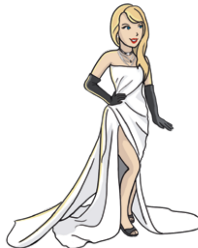
THE TORTURED POETS DEPARTMENT-TAYLOR