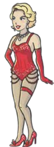
THE LIFE OF A SHOWGIRL-TAYLOR