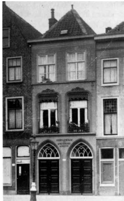
Exterieur kerkgebouw Gereformeerde Gemeente te Leiden.