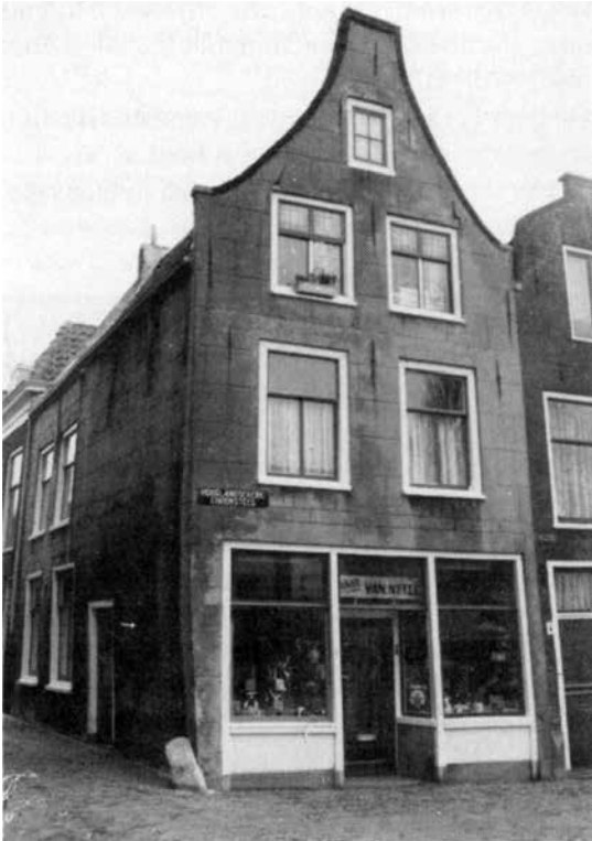
Woonhuis en winkel op de Hooglandsekerk Choorsteeg in Leiden.

Naar schatting was in 1936 een derde van de arbeiders in de stad werkloos. 16 Consumenten hadden dus betrekkelijk weinig geld om uit te geven aan genotsmiddelen.