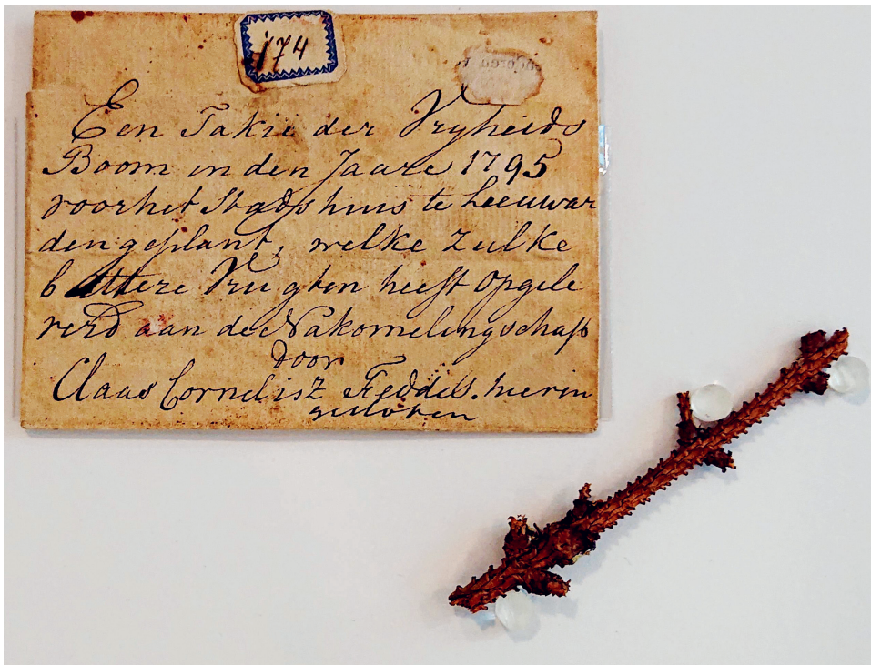
Takje van de in 1795 opgerichte Vrijheidsboom te Leeuwarden.