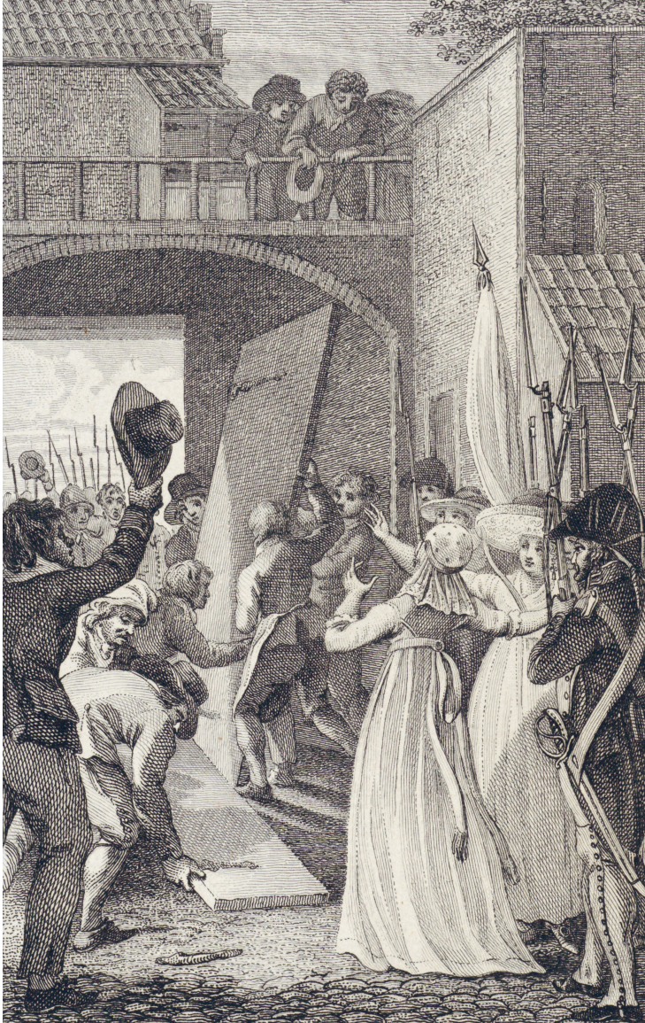
Het terugplaatsen van de houten deuren in de Franeker stadspoort op 5 maart 1795.

gelijk ook, want Franekers theatrale bevrijdingsparade had duidelijk tot doel de thuiscomers een hart onder de riem te steken. Het was een symbolische optocht van jarenlang eenzaam achtergebleven familieleden.