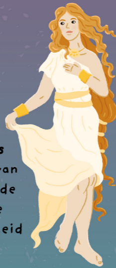
Venus godin van de liefde en de schoonheid