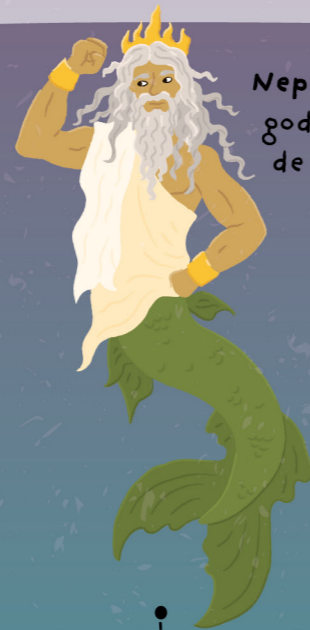
Neptunus god van de zee