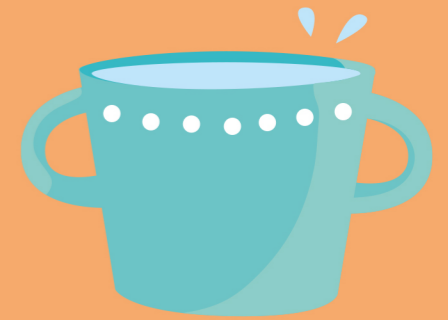
de beker la tasse the mug