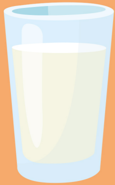
de melk le lait the milk