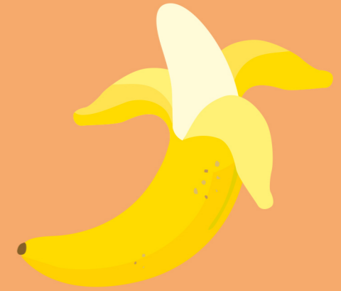
de banaan la banane the banana