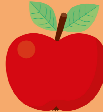
de appel la pomme the apple