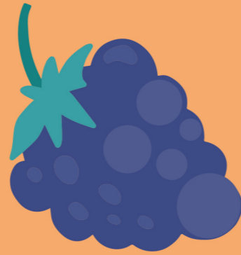
de druiven le raisin the grapes