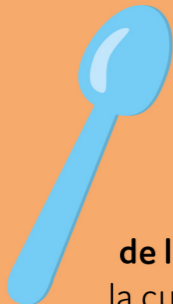
de lepel la cuillère the spoon