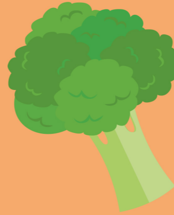
de broccoli le brocoli the broccoli