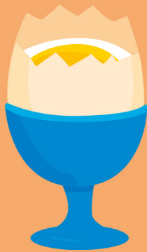
het ei l'œuf the egg