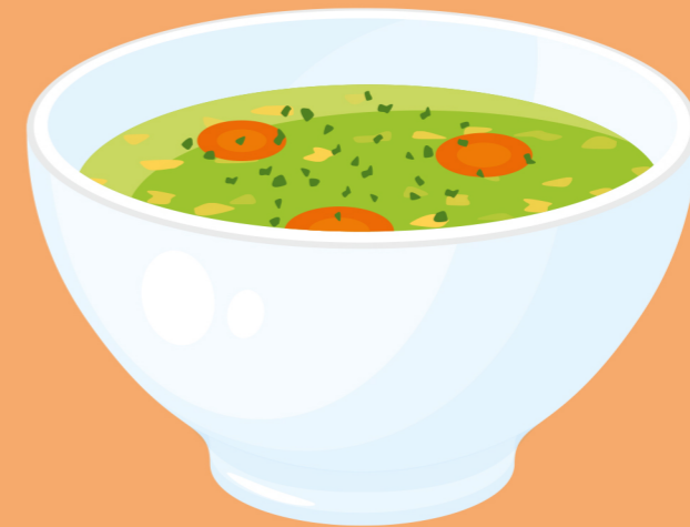
de soep la soupe the soup