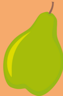
de peer la poire the pear