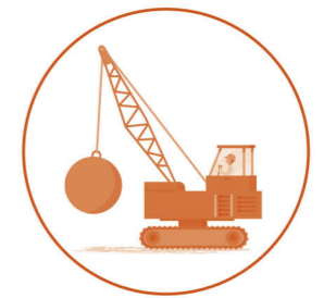
de sloopkogel- kraan