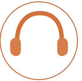
de gehoor- beschermers