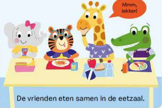
De vrienden eten samen in de eetzaal.

Beweeg de kleine wijzer naar de 12 en de grote wijzer naar de 12.