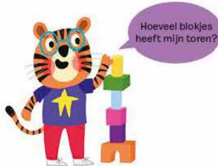
Tom telt zijn blokken.