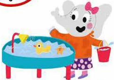
Ona speelt aan de watertafel.

Beweeg de kleine wijzer naar de 10 en de grote wijzer naar de 12.