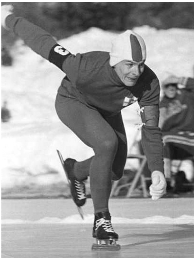
*Juhani Järvinen, één van de Finse schaatshelden in de jaren vijftig. Hij werd wereldkampioen allround in 1959.