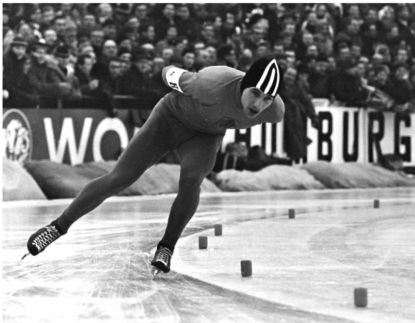
*Schaatsheld Kees Verkerk in actie, einde jaren zestig.

Broekman, ik kende zijn prestaties zelf nog van de verhalen van mijn vader en enkele ooms die ook schaatsfan waren, was eigenlijk een beetje de Piet Kleine van zijn tijd. Hij was vooral een topper op de 5000 en 10.000 meter, maar behaalde door een matige 500 meter slechts één internationale titel. Ook in dat opzicht vergelijkbaar met Piet Kleine, die éénmaal wereldkampioen werd. Maar hoe waren de 'schaatsverhoudingen' in de jaren veertig en vijftig nu precies? Je hoort tegenwoordig dan telkens de verhalen over Noorse 'overheersing' en de vele goede Russische stayers, maar was er ook nog een derde top-land toen? Jazeker. Na Noorwegen en Rusland (toen USSR) waren de Finnen vaak sterk.